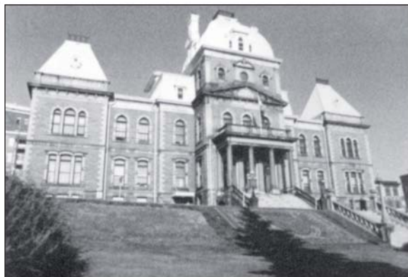
Figure 2 Hôtel de ville de Sherbrooke, 1972

comme le lieu de projection des discours des groupes dominants. L'exploitation de ce centre, à l'aide de symboles, est le résultat de stratégies de groupes. Ce n'est plus le discours de la ville, mais celui des points de repère qui sont précisés par leur forme, leur volume, leur couleur, leur position et leur signification d'après les groupes divers qui les fréquentent ou non (Boudon, 1971).