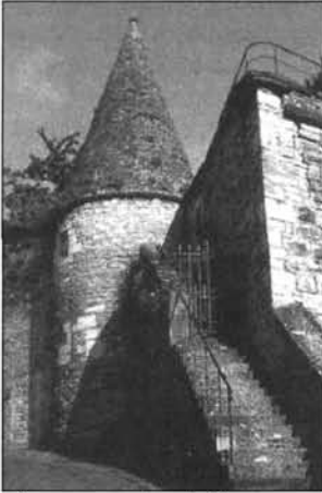
Figure 6 Remparts de Beaune

Ce qui n'est pas rien, sauf que... le musée des Beaux-Arts, le beffroi de Monge, l'hôtel de la Rochepot, l'église Saint-Nicolas, les vieilles demeures de la rue de Lorraine, les bains-douches du théâtre de verdure ou même ses remparts et bastions, sont-ils moins caractéristiques de Beaune, moins significatifs pour les Beaunois (figures 6, 7 et 8)? Et qu'en est-il de ces autres petits détails qui n'ont peut-être pas