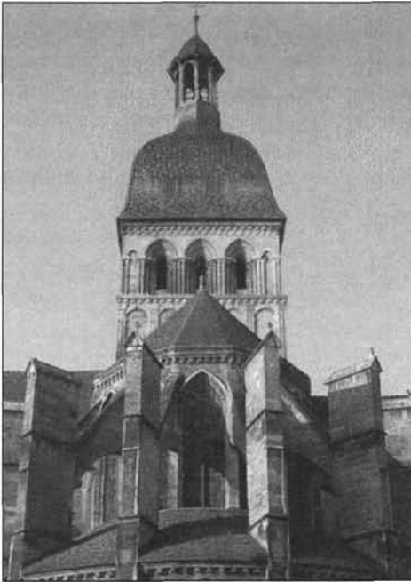
Figure 5 Abside de la Collégiale Notre-Dame

lieux comme la Collégiale Notre-Dame, avec son portail et ses tapisseries, ou l'ancien hôtel des Ducs de Bourgogne qui abrite aujourd'hui le Musée du Vin (figure 4) ne semblent pas avoir été choisis pour mieux représenter la tessiture du lieu et ses différentes composantes, mais bien plutôt pour décliner une même typicité, apparemment jugée seule essentielle et apte à atteindre les objectifs promotionnels souhaités. À la toute-puissance de l'Hôtel-Dieu correspond donc celle, à peine plus mitigée et moins impérative, des quelques bâtiments et places