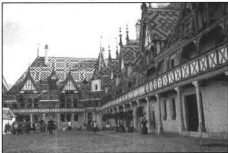
Figure 2 Cour d'honneur des hospices de Beaune

Avant de répondre à ces questions, nous constatons également que la mise en image de Beaune s'appuie à peu près exclusivement sur la cour d'honneur de l'Hôtel-Dieu des Hospices (figure 2), cour présentée sous divers angles et éclairages selon les prises de vue, et renvoyant au mieux à la salle des pôvres (figure 3)