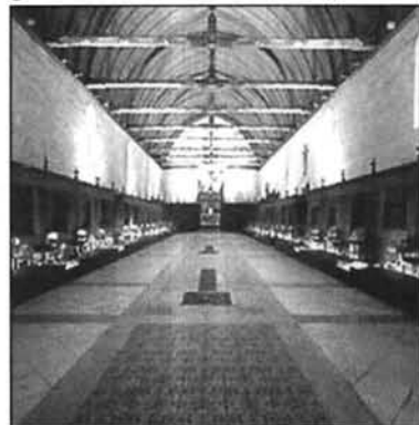
Figure 3 Chambre des pôvres