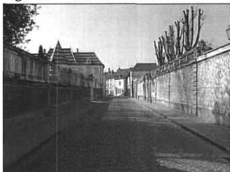
Figure 9 Rue du Château