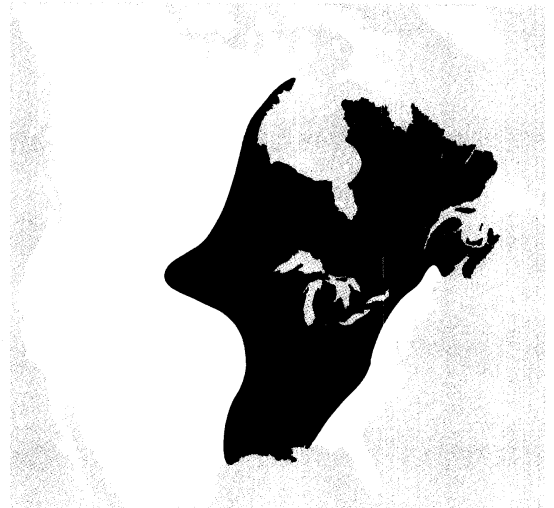
L'île québécoise au traité de Paris, 1763