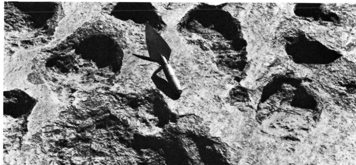
Photo 3 Vue détaillée de quelques alvéoles de corrosion dans anorthosite, rivage sud-est du lac Saint-Jean ; l'évidement des cavités est lié à l'action des vagues.