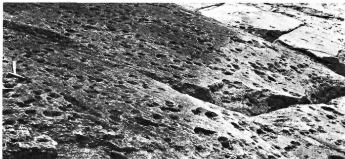
Photo 1 Micro-formes de corrosion dans anorthosite, rivage de la Grande-Décharge, secteur sud-est du lac Saint-Jean.