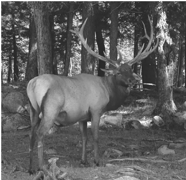
Le wapiti ou cerf américain L'aire de répartition du wapiti englobait la vallée du Saint-Laurent au début de la Nouvelle-France. Mais son abondance demeure une question à l'étude. (Daniel Fortin).

de son manuscrit, le jésuite discourt sur les preuves de cette propriété qu'il aurait lui-même observées :