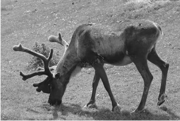
Le caribou des bois

informations contenues dans les douze livres de l'Histoire naturelle des Indes occidentales et le Traité des animaux à quatre pieds terrestres et amphibies , les autres manuscrits présentement connus du jésuite. Dans cet article, nous nous intéresserons à l'Histoire naturelle .