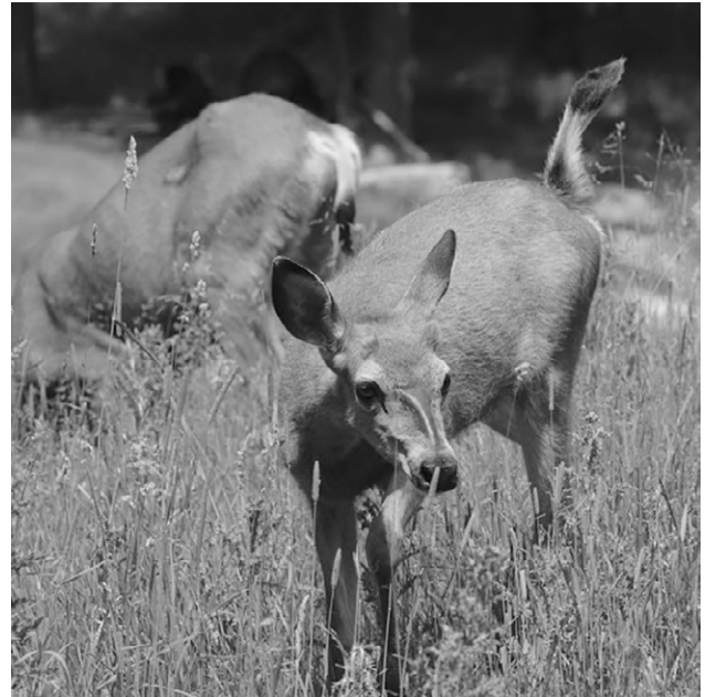
Le chevreuil ou cerf de Virginie

originaux, « [il] y a des plages et des contrées dans nos pays étrangers où l'on voit 5 ou 600 de ces animaux ensemble [sic] » [feuillelet 83]. Il est fort possible que la pression de chasse des Autochtones et des Français ait eu raison de l'espèce, du moins dans la vallée du Saint-Laurent et autour des Grands Lacs les plus à l'est de l'Amérique du Nord.