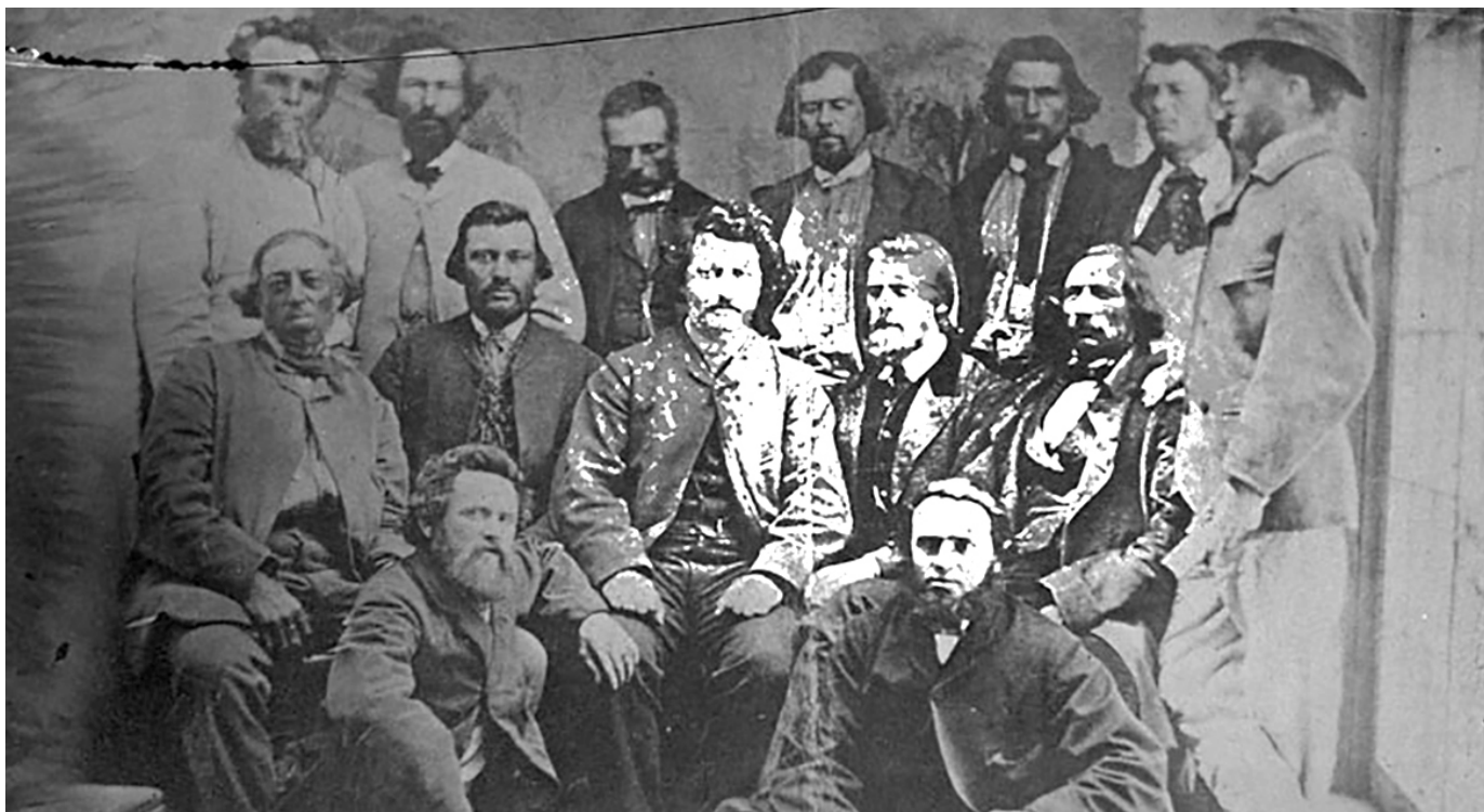
Louis Riel et les conseillers du gouvernement provisoire de la nation métisse. Négatif sur plaque de verre (1870).