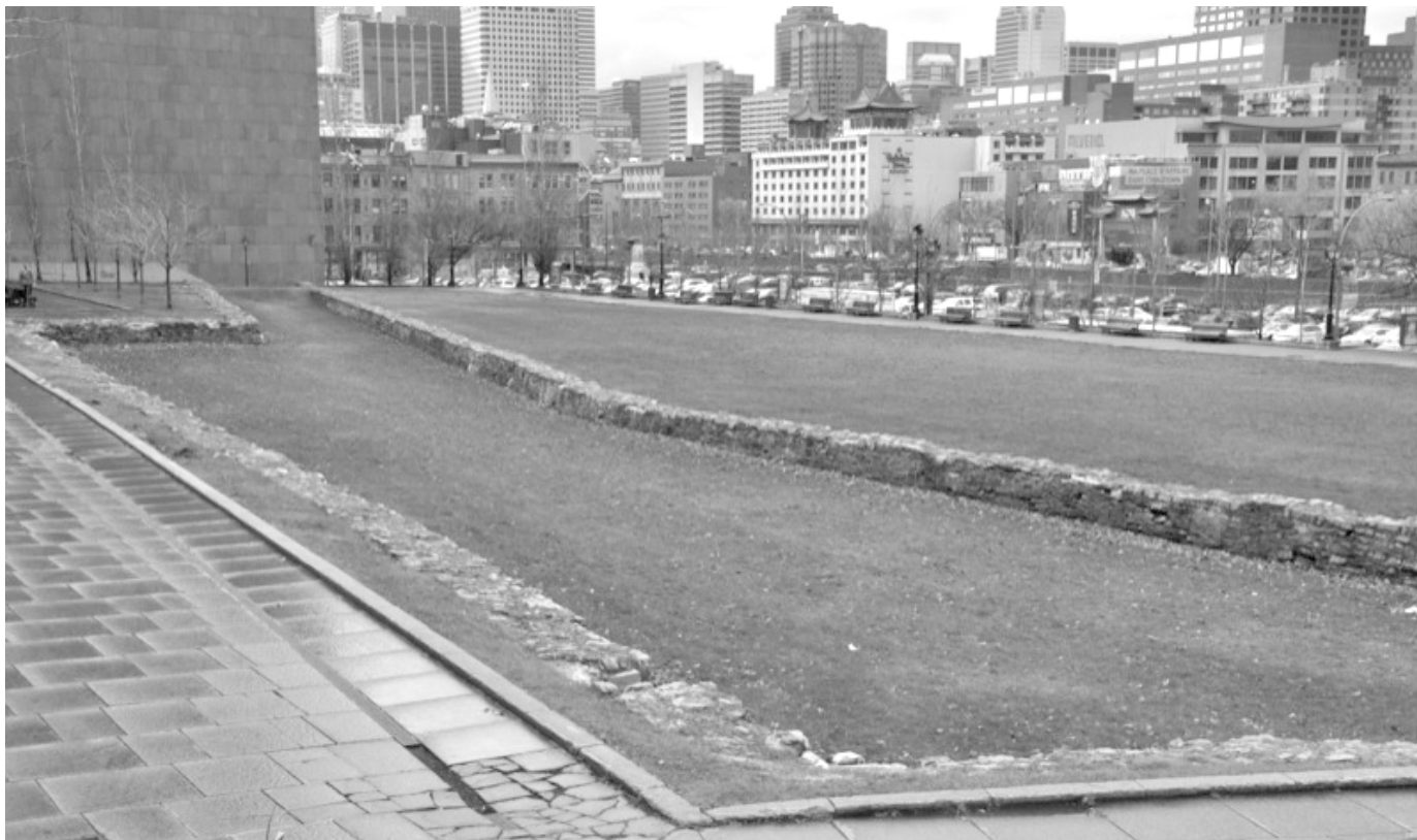
Traces actuelles des fortifications au Champs-de-Mars, Montréal. (Photo : Christian Lemire). http://www.patrimoine-culturel.gouv.qc.ca/rpcq/detail.do?methode=consulter&id=116983&type=bien#.XdQ62FdKi70

phologie tendant vers l'extérieur de la ville. Dans son propre projet de rénovation urbaine, New York développe un plan basé sur une grille orthogonale à partir de 1811. En lien avec les considérations d'aération et d'efficacité bien en vogue, en particulier aux États-Unis, les commissaires adoptent un plan similaire pour joindre les rues des faubourgs. Cette grille urbaine, quoique moins rigide que celle de New York, donne néanmoins un profil plus moderne à la ville tout en facilitant les futurs développements fonciers.