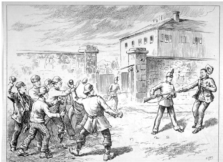
MONTREAL.—ATTACK ON A SENTRY OF THE MONTREAL CARBINIERS AT THE QUEBEC GATE BARRACKS. THE SENTRY, IN SELF-DEFENSE, PLUNGES HIS BAYONET IN THE BREAST OF ONE OF THE LEADERS AND KILLS HIM.

La construction des murs maçonnés au XVIII e siècle avait fixé de façon permanente la configuration de la trame urbaine à l'intérieur de la ville. Le projet d'aménagement présent en fixe la mor-