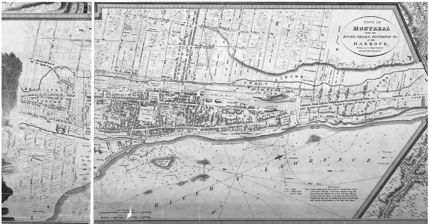
Portion de la carte de Montréal de Joseph Bouchette, 1815. (Archives de Montréal, CA M001 VM 066-3-P016).

sont situées. En effet, les lots confisqués pour la construction des murs et des glacis doivent être redonnés aux héritiers, s'il en reste afin qu'ils puissent en disposer à leur guise. Les projets de démolition constituent l'étape suivante. L'amélioration de l'efficacité et de la circulation étant considérée comme essentielle, les portes sont détruites en premier, puis les murs faisant face au fleuve, pour enfin terminer par les murs du côté nord. L'étape clé est toutefois celle de la planification urbaine. En effet, les commissaires sont mandatés par le gouvernement pour pourvoir à « la Salubrité, la Commodité et l'Embellissement » de la ville. Ainsi, alors que le centre connaît plutôt de petites rues sinueuses et engorgées, des avenues larges sont tracées sur les emplacements de plusieurs des murs, comme la rue des Commissaires (aujourd'hui la rue de la Commune), la rue Saint-Jacques et la rue McGill. Pour favoriser l'efficacité de la ville et en désengorger le cœur historique, deux nouvelles places de marché sont ouvertes. La première est la place des Commissaires (square Victoria) qui