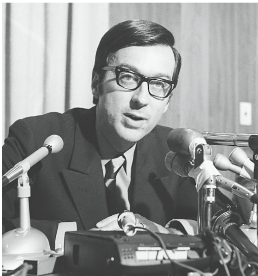
Le premier ministre Robert Bourassa annonçant le projet de la Baie-James, en 1971.