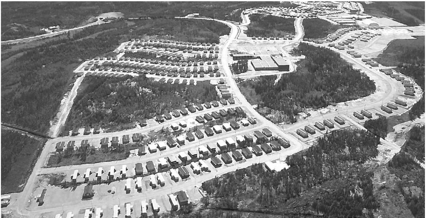
Campement des travailleurs à la Baie-James. ( Le Jamésien , 1981).

perception de la vie en milieu nordique. Bien que Le Jamésien ait été principalement lu par les employés de la SDBJ, on sait que la portée d' En Grande dépassait le simple cercle des travailleurs de la Baie-James. Selon le rapport annuel de la SEBJ publié en 1974, En Grande sert de liaison avec une centaine de médias d'information partout au Québec, principalement des radios et des journaux. Selon le numéro d'août 1981, c'est en moyenne 21 500 exemplaires de ce bimensuel qui furent distribués en 1979, dont 7 000 à des abonnés en dehors du complexe. Le numéro spécial sur LG2, pour sa part, a été imprimé à 68 000 exemplaires. Il est de ce fait un important vecteur de représentations au sein de la société québécoise.