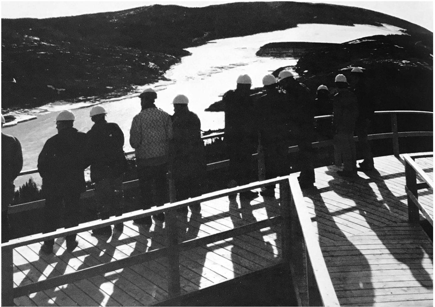
Ouvriers à la Baie-James. (Rapport de la SEBJ, 1975).