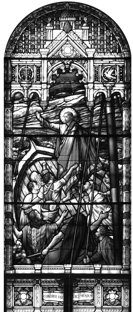
Jésus calmant la tempête, église Saint-Léon-de-Westmount, Westmount.