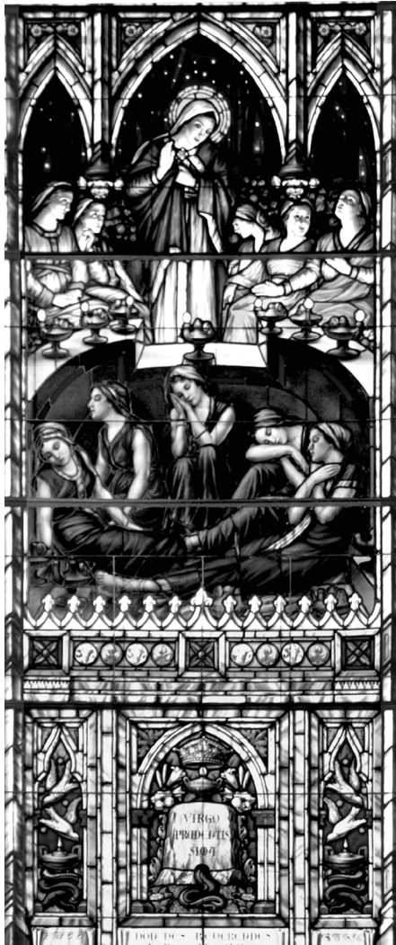
Virgo prudentissima, cathédrale de l'Assomption, Trois-Rivières.