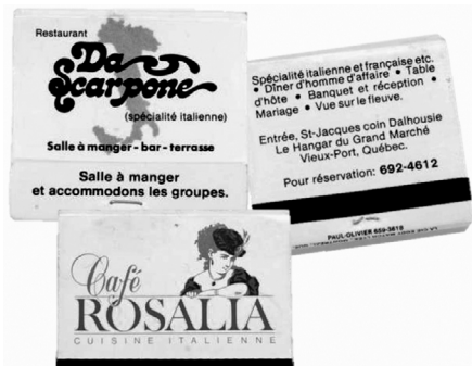
Cartons d'allumettes à l'effigie du restaurant italien Da Scarpone et du Café Rosalia, Québec, dernier quart du XX e siècle. (Musée de la civilisation, don de Yolaine Turcotte, 2010-799 et 2010-819).

bec est Guido Malnig. Profitant d'une escale pour descendre du navire transatlantique où il officie en tant que barman, il décide, à l'automne 1961, de quitter son emploi pour s'établir à Québec.