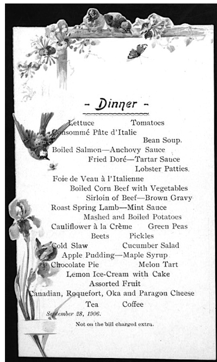
Menu du soir ( dinner ) de l'hôtel Clarendon à Québec, 28 septembre 1906, où apparaissent les mentions « Consommé pâte d'Italie » et « Foie de veau à l'italienne ». Ne nous leurrions pas : la présence de ces mets dits italiens, aux côtés de la surlonge de bœuf et de l'agneau en sauce à la menthe, ne reflète guère plus qu'une volonté d'offrir un menu « européen » à une clientèle touristique anglo-saxonne. (New York Public Library, The Buttolph collection of menus, image n° 473668. Domaine public).

civique, alors que bien des villes créent leur sauce « signature », comme alla bolognese ou napolitaine, des dénominations encore en usage aujourd'hui. Il faut être plus patient avant de voir arriver