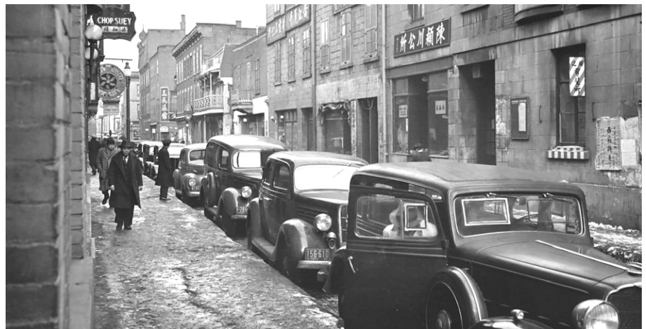
Photo d'une rue du quartier chinois montrant des commerces sino-montréalais et des voitures garées. 29 février 1940.

Cette perception d'une consommation uniquement sino-montréalaise de l'opium fait tout de même abstraction d'une autre dimension du phénomène. En effet, non seulement les Sino-Montréalais n'étaient-ils pas tous des consommateurs d'opium, mais une partie des usagers des fumeries d'opium du quartier chinois étaient des Canadiens d'ascendance européenne, comme en témoignent les journaux et les rapports d'arrestations des services policiers. Qualifié en Occident de « drogue des poètes », l'opium était notamment consommé par des écrivains et des artistes qui lui attribuaient des effets bénéfiques. Cette drogue, opinaient-ils, stimulaient leur créativité. Elle était