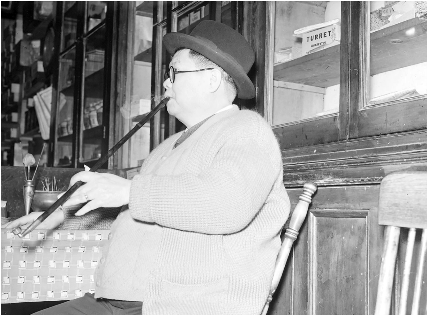
Un fumeur utilisant une pipe à opium dans le quartier chinois de Montréal. 3 mars 1940. Fonds Conrad Poirier. (BAHQ Vieux-Montréal, P48, S1, P5163).

réécits entourant l'opium et les établissements où il est consommé.