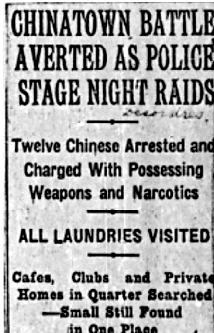
Cet article mentionne une descente systématique dans le quartier à la recherche d'éléments liés aux narcotiques, mais également à d'autres vices. «Chinatown Battle Averted as Police Stage Night Raids», The Montreal Gazette , 1934, 22 janvier 1934, p. 10. (Archives de Montréal).

L'année 1949 sonne le déclin des fumeries d'opium sino-montréalaises. Le gouvernement chinois, en mettant en place des réglementations qui visent à rendre progressivement l'opium et sa production illégales, limite grandement l'approvisionnement par les canaux d'échanges chinois. Les arrestations des consommateurs de narcotiques sino-montréalais relatées dans les médias ont trait à d'autres drogues, notamment l'opioïde qu'est l'héroïne. Bien que toujours liée à la consommation d'opium dans la mémoire et les représentations, une distanciation se produit entre la communauté sino-montréalaise et cette drogue. Avec les projets de renouvellement urbains du quartier chinois qui débutent dans les années 1960, l'opium est presque dissocié des Sino-Montréalais alors que leur