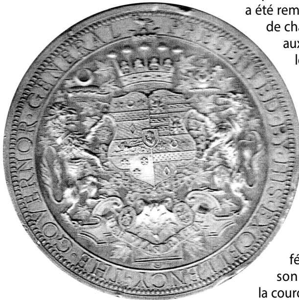
Avers et revers de la médaille du Gouverneur général Dufferin.

E n 1873, le gouverneur général du Canada, Frederick Temple Blackwood, lord Dufferin, bien connu pour ses interventions pour la protection des fortifications et des anciennes portes de Québec, a fait émettre une médaille à son effigie et à celle de son épouse, Harriot Georgina Rowan Hamilton par la maison Wyon, de Londres. Cette médaille est frappée en or, en argent ou en bronze. Tous les gouverneurs qui se sont succédé depuis ont poursuivi l'initiative. La médaille a été remise d'abord aux gagnants de championnats sportifs, puis aux étudiants méritants dans les institutions d'enseignement canadiennes.