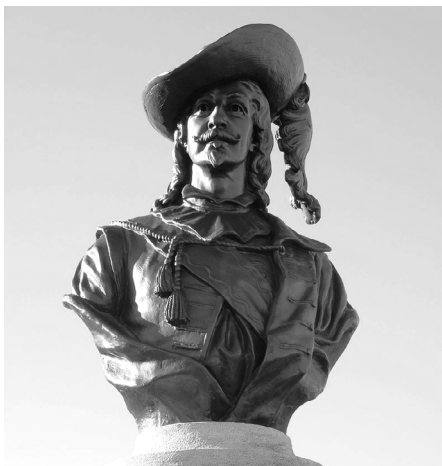
Monument de Pierre Dugua de Mons, par Hamilton MacCarthy, érigé en 2007, sur l'avenue Saint-Denis, près de la citadelle de Québec. ( https://fr.wikipedia.org/wiki/Pierre_Dugua_de_Mons ).

des êtres inférieurs, des « sauvages » que Champlain et ses contemporains (et par extension les Canadiens français) étaient venus « civiliser ». Ce récit a eu des conséquences néfastes considérables sur la connaissance de l'histoire du début du XVII e siècle. Pendant longtemps, on a ignoré les faits suivants. Une alliance franco-montagnaise scellée près de Tadoussac en 1603 a rendu possible la fondation de Québec en 1608. Le roi Henri IV a demandé et obtenu la permission d'envoyer des hommes en territoire montagnais. C'est Henri IV qui a élaboré la politique d'alliances de la France avec les « princes » autochtones et non pas Champlain. Il reconnaissait que les autochtones formaient des « peuples » et des « nations », comme Champlain dans ses récits. Champlain et les chefs alliés se disaient « frères ». Les environs de Québec n'étaient pas inhabités et il y avait une cohabitation. Les Montagnais-Innus nommaient Québec « Uepishtikueiau » (j'en connais qui le nomment encore ainsi). Le toponyme Québec serait issu d'un malentendu (de « kapak » en innu aimun, qui signifie « débarquez », et non « là où la rivière rétrécit » (« uepishitkueiau »)... J'ai étudié le déni de la contribution amérindienne à la fondation dans d'autres recherches. Pour des raisons pratiques, je n'y reviens pas ici. Il en va de même pour la contribution cruciale