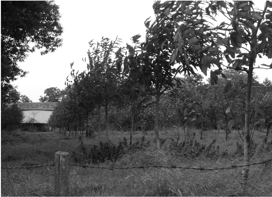
Terre de Champlain à Saint-Pierre-des-Landes.