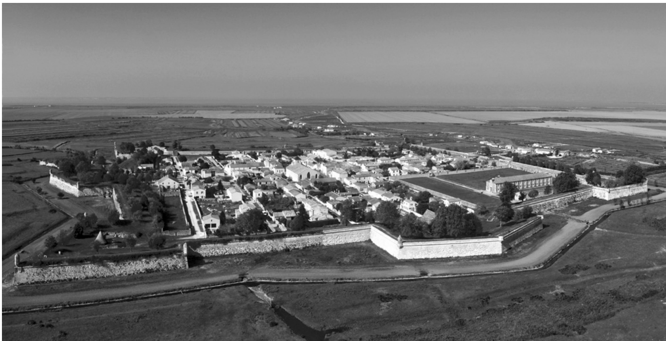
Vue actuelle de la ville de Brouage. (Archives de l'auteur).