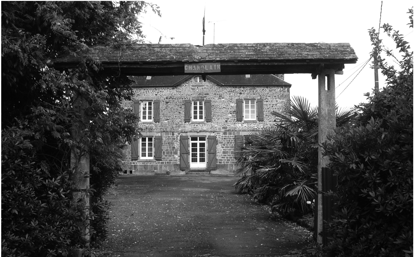
Ferme de Champlain à Saint-Pierre-des-Landes.