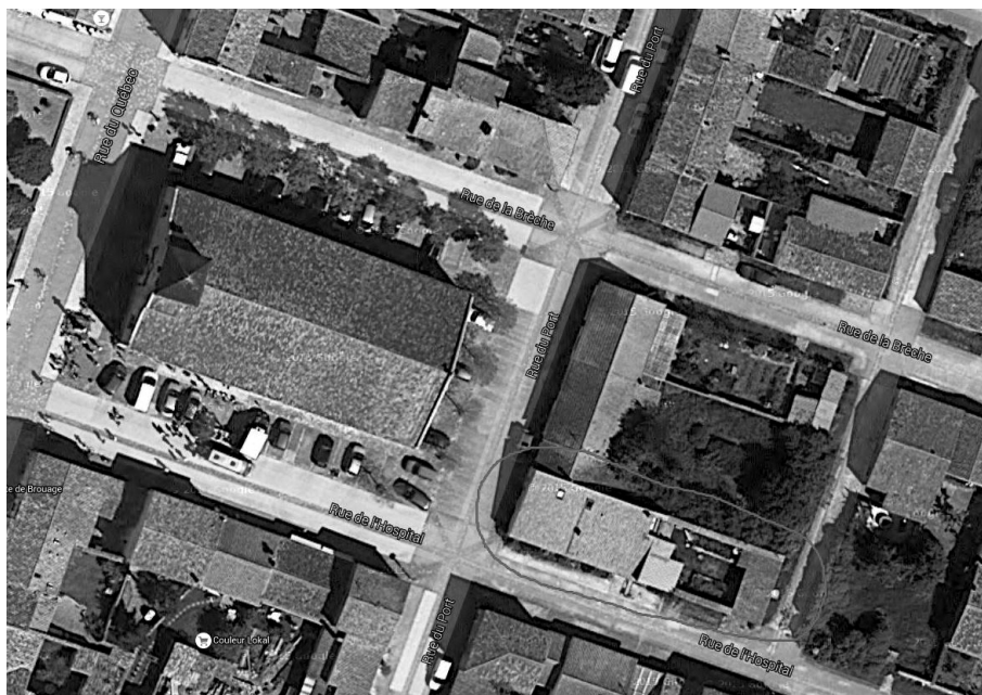
Emplacement de la maison natale de Champlain à Brouage.

le 2 octobre 1576, dans leur maison de Champlain, est mentionné dans un registre pastoral vitréen.