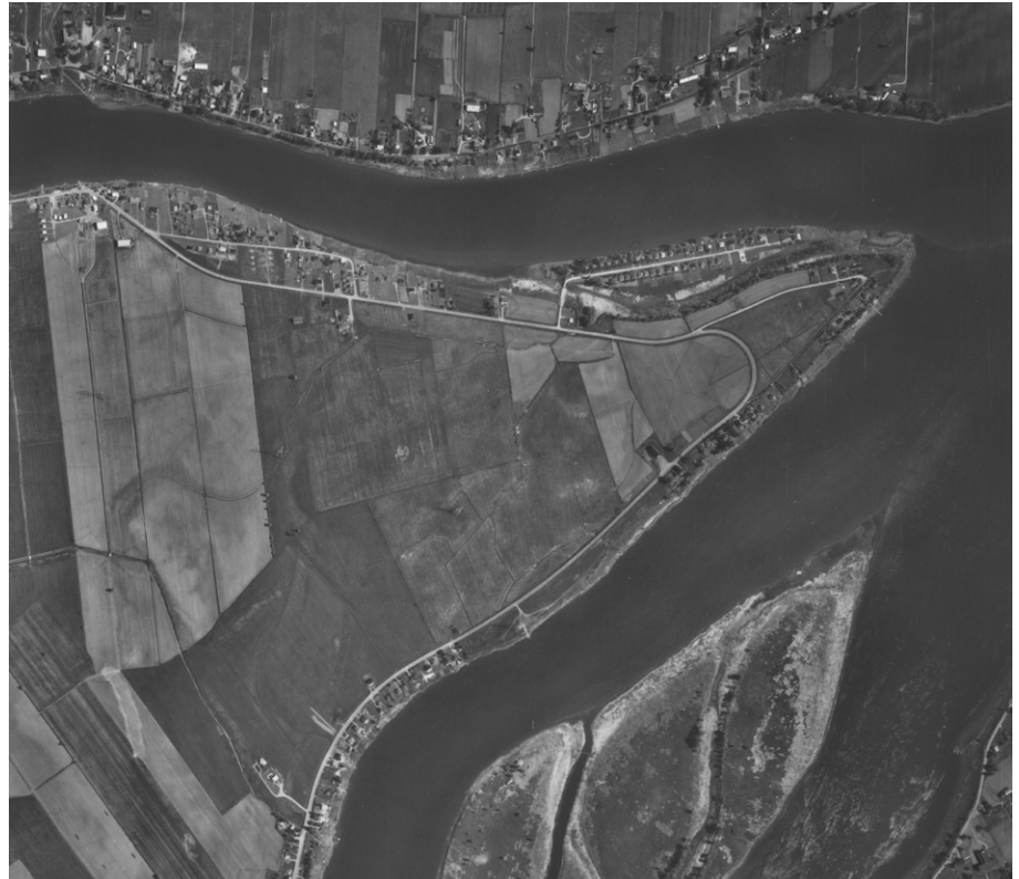
Extrémité est de Laval, 1965, photographie aérienne (détail)