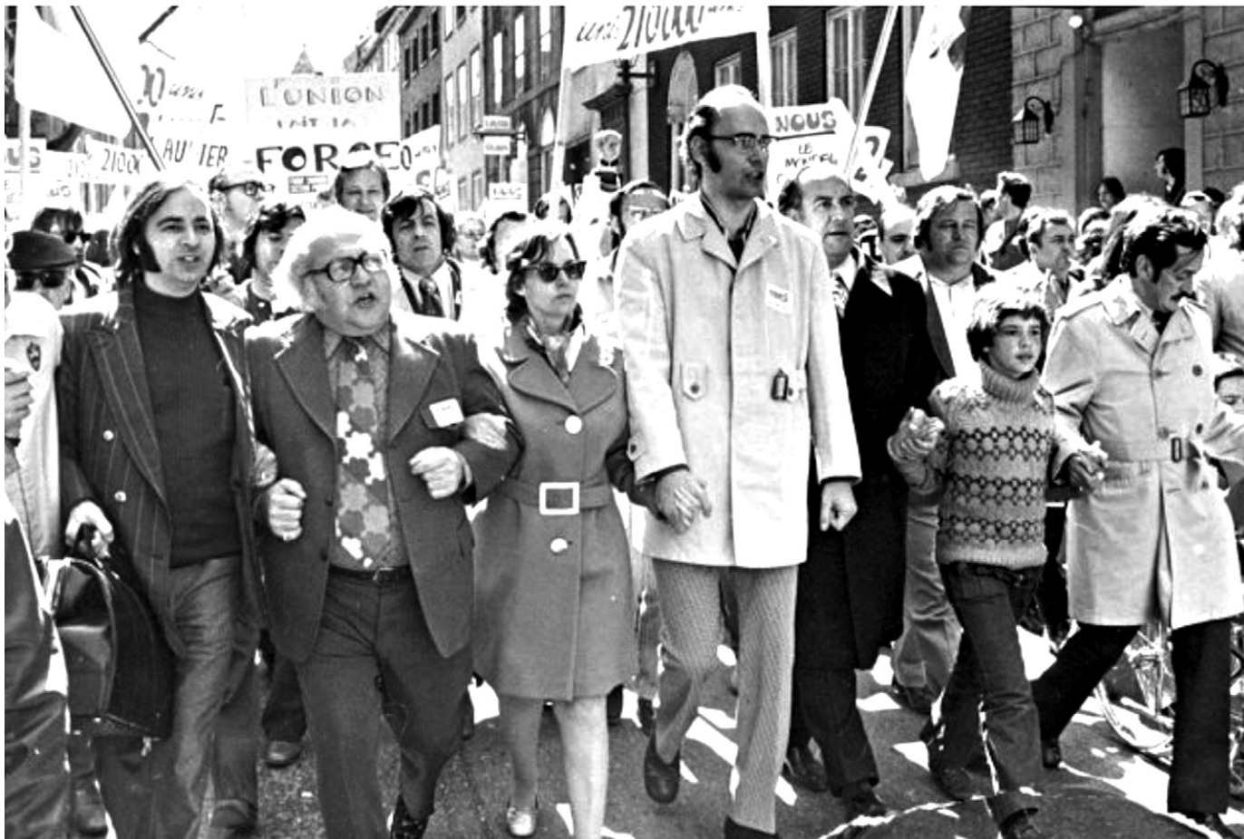
Manifestation du Front commun de 1972 dans les rues de Québec. Participant à la manifestation les chefs des trois centrales syndicales : Louis Laberge, FTQ (deuxième à partir de la gauche), Yvon Charbonneau, CEQ (quatrième) et Marcel Pépin, CSN (derrière M. Charbonneau).