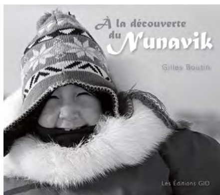
Gilles Boutin. À la découverte du Nunavik . Québec, Les Éditions GID, 2014, 223 p.

Le photographe derrière le très bel ouvrage Les aurores boréales Québec-Nunavik , en 2009, nous revient cette fois avec À la découverte du Nunavik . Le livre s'ouvre sur une inspirante photo, présentant le brouillard qui se lève sur le Nunavik, comme si l'auteur voulait mettre en image son objectif, soit de lever le voile sur cette contrée du nord du Québec, souvent mal connue.