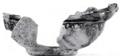
Une navette à encens en terre cuite de Saintonge polychrome, dont les fragments proviennent de différents niveaux de l'occupation du fort de Ville-Marie.

Mais les rencontres amorcées par Champlain au début du XVII e siècle changent la donne : la pointe devient un lieu propice aux échanges ne nécessitant qu'un séjour bref, à la belle saison. La présence amérindienne y est dès lors perceptible à travers le mobilier archéologique où se retrouvent aussi des objets européens. Le site aurait ainsi pris une nouvelle connotation, devenant un lieu de