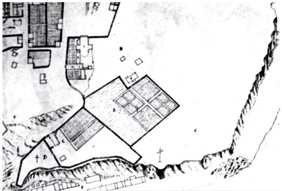
Détail du plan de Vateau de 1670.

Avant même le milieu du siècle, le couple Couillard aura acquis la part des autres membres de la famille et deviendra l'unique propriétaire du fief. Puis, Guillemette, veuve depuis trois ans,