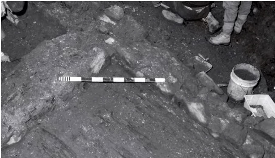
Vestiges de la maison Couillard, avec son plancher, retrouvés en 1991.

dans le stationnement du Séminaire, du côté de la rue des Remparts. C'est en effet dans le cadre d'une fouille de prospection que nous dirigions à proximité de l'Évêché, en 1993, que furent mis au jour des vestiges qui allaient s'avérer d'un grand intérêt.