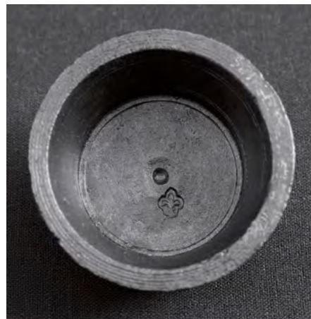
Petit poids d'apothicaire retrouvé dans les vestiges de la maison Couillard.

Évidemment, beaucoup reste à découvrir sur le site du fief du Sault-au-Matelot. Malgré cela, l'ensemble des données et des évidences environnementales recueillies à ce jour lors des fouilles permettent de tirer une image un peu plus