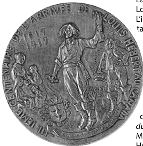
Médaille Louis Hébert conçue par le sculpteur Alfred Laliberté afin de souligner l'inauguration du monument, en 1918, et le 300 e anniversaire de son arrivée à Québec, en 1617.