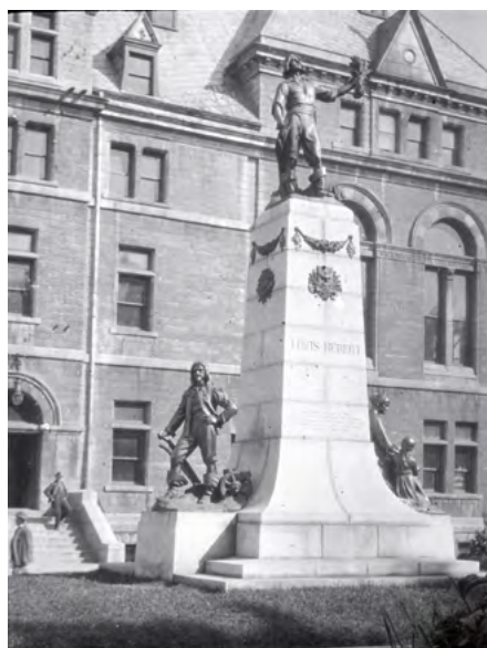
Œuvre du sculpteur Alfred Laliberté. Le monument Louis Hébert est inauguré le 3 septembre 1918 près de l'hôtel de ville de Québec.

En 1920, Azarie Couillard-Després publie le Rapport des fêtes du III e centenaire de l'arrivée de Louis Hébert au Canada . Sortant des presses de l'Imprimerie de La Salle à Montréal, l'ouvrage fait 180 pages et il est divisé en deux parties. Ce rapport montre que le prêtre historien a été l'un des plus ardents promoteurs du projet