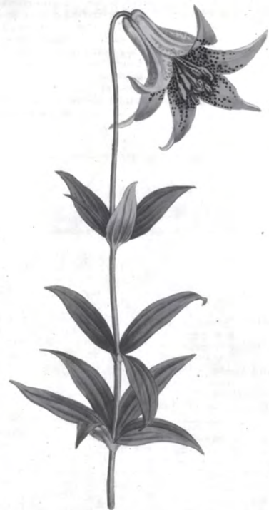
Le lis du Canada (lilium canadense) . Syd. Edward (dessinateur), F. Sansom (graveur). Publié par St. Geo. Crescent, T. Curtis, décembre 1804. (planche 800).

Les relations de Louis Hébert à Paris ne sont pas parfaitement connues. Il a dû correspondre avec les Robin, car les auteurs signalent fréquemment la qualité des plantes de leur jardin. L'un et l'autre s'intéressent vivement aux plantes nouvelles. Ils avaient créé un jardin à la pointe de la Cité dès la fin du XVI e siècle. Jean, le père, est devenu curateur du jardin de l'École de médecine