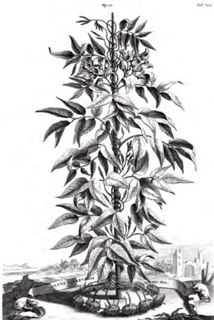
Glans terrestris Americana . Abraham Munting. Naauwkeurige Beschryving Der Aardgewassen, Leyden & Utrecht, 1696. (folio 349).