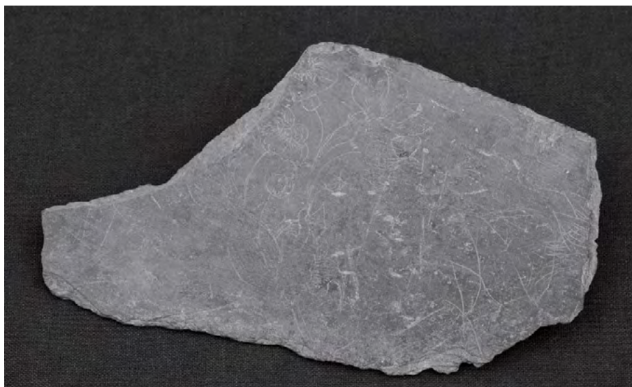
Plaque d'ardoise gravée de motifs floraux stylisés, occupation de la maison Hébert-Couillard, 1617-1677. Séminaire de Québec, collections archéologiques de la Ville de Québec, ( http://archeologie.ville.quebec.qc.ca/sites/seminaire-de-quebec/seminaire-de-quebec-une-ferme-du-17-sup-e-sup-siecle/).

Dans ses descriptions, Cornuti marie tradition et innovation. Aux citations des travaux des savants de l'Antiquité, il ajoute le fruit de ses observations conduites sur le terrain en France. Issue d'une démarche d'apothicaire et centrée sur les fins médicinales, sa publication rejoint en partie les orientations du Jardin royal des plantes. Ses descriptions des plantes originaires du Canada couvrent les feuilles, les tiges, les racines, les fleurs et les fruits. Le médecin procède à des expérimentations personnelles concernant les purgatifs, vomitifs et aromates. Il mâche, goûte, distille, assèche et pile feuilles, racines et fleurs, dissèque, concocte et prend des potions. Il approfondit en quelque sorte les pré-occupations de Louis Hébert. Par contre, n'étant jamais venu en Amérique, il ne peut faire état des usages amérindiens.