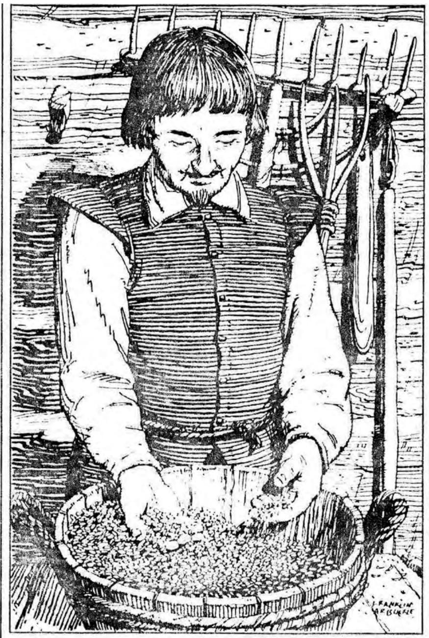
Représentation de Louis Hébert apothicaire offerte par la brasserie Labatt à ses clients.

L'histoire de cet apport de la Nouvelle-France repose sur les réalisations de personnages plus ou moins connus. Au départ, Louis Hébert, un simple apothicaire parisien, se résout, en 1606, à l'âge de 31 ans, à gagner les terres neuves d'Amérique du Nord, puis en 1617, âgé de 42 ans, il s'installe à Québec avec sa famille. Il y repère des plantes que, selon toute vraisemblance, il fait parvenir en France. Le contexte de la création du Jardin royal des plantes à Paris amène ensuite un docteur régent de la faculté de médecine de Paris, Jacques-Philippe Cornuti, à publier en 1635 un Canadiensum Plantarum . Dès lors, au fil des ans et des publications, ces plantes présentes dans le milieu de vie de Louis Hébert sont portées à la connaissance de la communauté scientifique européenne.