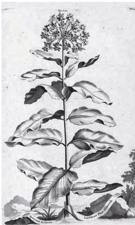
Asclepias syriaca L. [as Apocynum Syriacum latifolium flore glomeroso ]. Abaraham Munting. Naauwkeurige beschrijving der aardgewassen, vol. 1: p. 346, t. 104 (1696).

Pourtant, ce sont des relations interpersonnelles qui ont vraisemblablement abouti à mieux faire connaître les plantes du Canada. Un des frères de Louis Hébert, Jacques, entré chez les Minimes en 1588, a sans doute joué un rôle. C'est à cette communauté religieuse que Cornuti offrait ses services médicaux de façon bénévole. Au surplus, dans sa publication, l'auteur du premier livre de plantes du Canada fait souvent référence à des plantes trouvées dans le jardin des Robin.