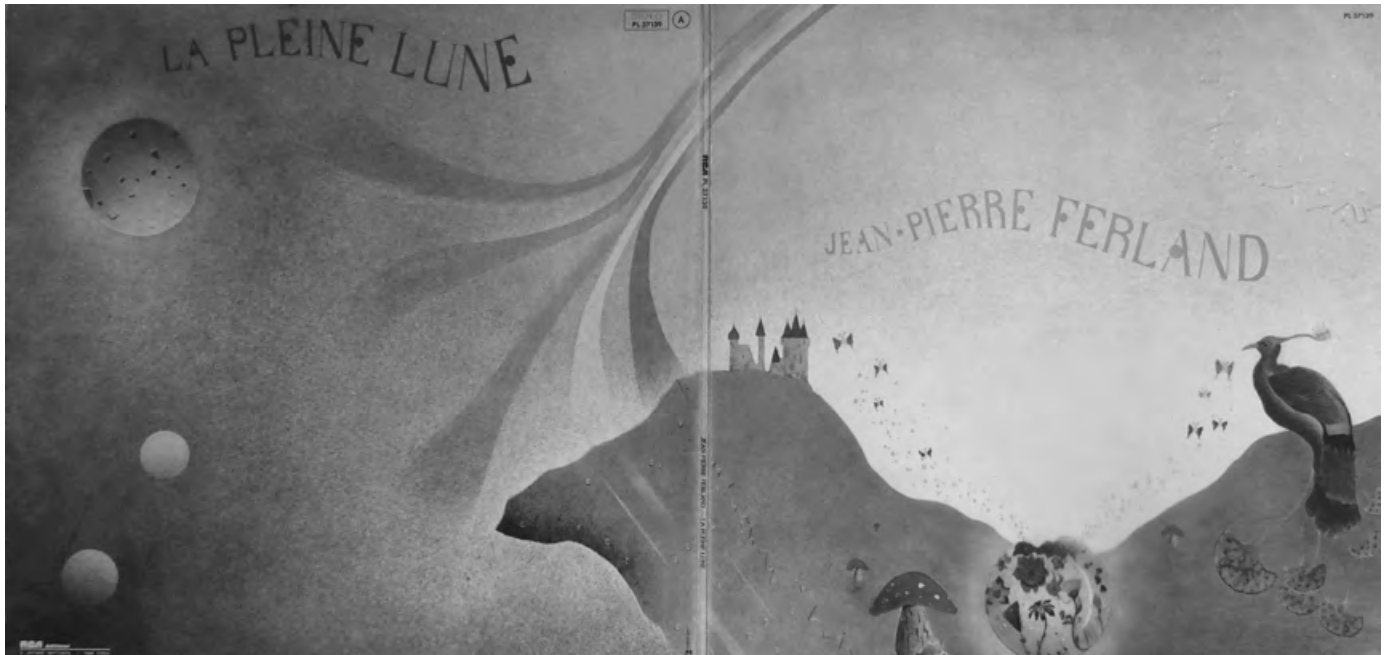
La pleine lune (Telson, AE-1510, 1977). Un des meilleurs disques de Ferland, et le plus injustement sous-estimé. Une production impeccable et une sonorité riche. Malheureusement, une mauvaise distribution a fait en sorte que ce 33 tours n'est plus disponible, c'est-à-dire qu'il a été retiré de la section régulière des disquaires pour être reclassé pêle-mêle dans la section des disques à prix réduit. (Coll. de l'auteur).

Et puis parfois je me considère... j'ai peur d'être un imposteur parce que j'étais pas fait, pas construit pour faire ce métier. Mais la vie a été bonne pour moi, puis la chance aussi.