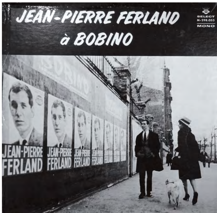
Jean-Pierre Ferland à Bobino. Ce disque 33 tours n'est pas le premier de Jean-Pierre Ferland, mais son cinquième; c'est toutefois son premier enregistrement en public sur disque. Il correspond à la période « parisienne » du chansonnier qui accédait à cette mythique salle, où se produisaient alors des artistes comme Georges Brassens et Léo Ferré. Vers 1963.