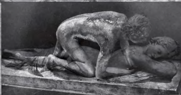
Androgyne. Dernier 33 tours de Jean-Pierre Ferland avant un silence de huit ans sur disque. Jamais réédité en CD. Jaune, PJ-1001, 1984. Ici encore, Ferland était en avance sur son temps et se renouvelait sans cesse.

tout faire en 3/4, à écrire en 3/4, la valse. Tout le temps la valse. Et puis le 3/4, c'est devenu très ancien. Le 4/4 est moderne, le 2/4 est presque disparu. Il faut s'ajuster. Si on veut créer l'intérêt chez les jeunes, alors, il faut tout rebâtir. Alors je me suis amusé. Je trouve que ma voix est meilleure ces temps-ci. Alors on va faire Mes chansons jalouses , juste pour s'amuser et rendre hommage aussi ».