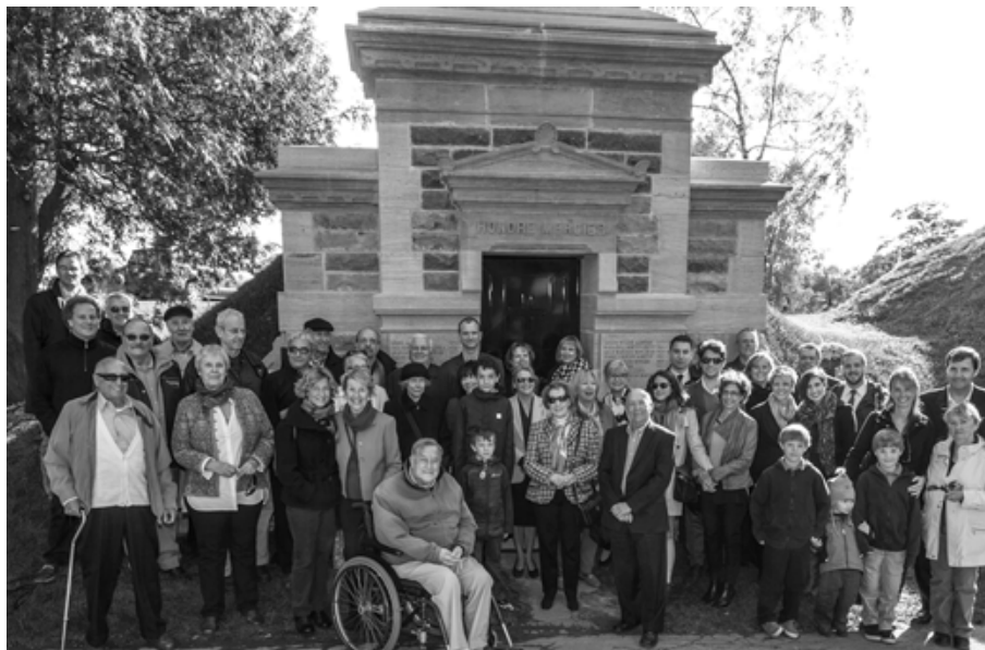
Inauguration du mausolée restauré d'Honoré Mercier. Plusieurs des descendants de la famille Mercier, réunis pour l'occasion.

Le premier ministre Philippe Couillard a profité de l'événement pour rendre hommage aux hommes et aux femmes qui ont choisi de consacrer leur vie à la politique. La ministre St-Pierre a souligné pour sa part que les premiers ministres ont influencé le cours de l'histoire et méritent d'être rappelés à la mémoire des Québécoises et des Québécois. De son côté, la ministre de la Culture et des Communications et ministre responsable de la Protection et de la Promotion de la langue française, Hélène David, a rappelé que les premiers ministres québécois décédés ont été les