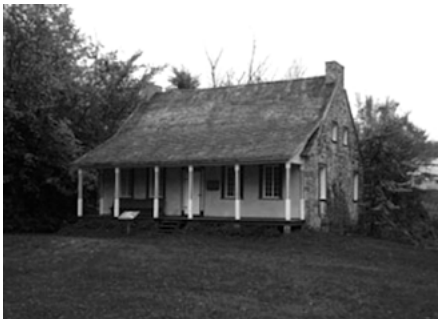
Église St. James Anglican Church à Saint-Jacques-de-Leeds. ( http://followshannon.com/murder-in-quebec-brings-down-government/ ).

Une première église voit le jour en 1831 grâce à l'appui du révérend anglican James Lynne Alexander. Homme cultivé et entreprenant (il est l'auteur d'un des premiers ouvrages en vers du Haut-Canada), il agit aussi comme instituteur en plus de faire construire le presbytère. La forte présence anglophone dans le canton se manifeste aussi peu à peu par l'apparition de multiples loges de l'ordre d'Orange, une société fraternelle protestante irlandaise à forte vocation communautaire. De manière générale, les fidèles des différentes confessions religieuses ont tendance à s'entraider. Cela se manifeste de diverses façons : appuyer financièrement