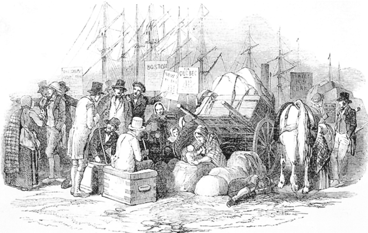
EMIGRANTS ARRIVAL AT QUAY.—A SCENE ON THE QUAY.

Des Irlandais quittent la Grande-Bretagne pour venir en Amérique. Gravure tirée de Illustrated London News . (Bibliothèque et Archives Canada, C-003904).