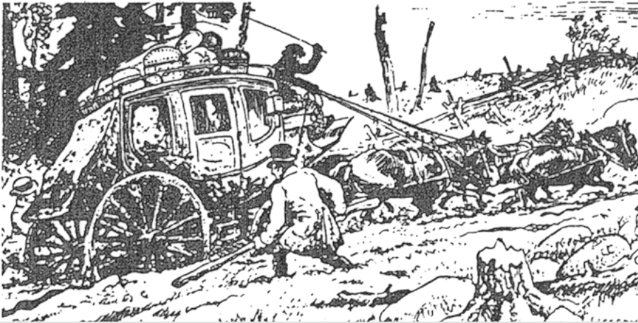
C.W. Jeffereys. Service de diligence sur le chemin Craig établi entre Québec et Boston, en 1811.

de moutons. Par crainte de perdre leur statut social, plusieurs Écossais motivés partent avec toute leur famille, séduits par la promesse de terres bon marché. Quant à l'Irlande, elle est au début du XIX e siècle une région surpeuplée de gens vivant surtout d'agriculture. La population y a tellement augmenté (de 2,8 millions en 1712 à 8,5 millions en 1841) que les terres sont devenues trop petites pour pouvoir être partagées davantage. Déjà, avant la grande famine, les mauvaises récoltes s'accumulent. Quant aux artisans, ils n'arrivent pas à atteindre les rendements de la nouvelle industrie mécanisée du lin. Les tensions religieuses finissent par convaincre bien des Irlandais, pour la plupart des fermiers protestants, de traverser l'Atlantique. Si les raisons exactes du départ des pionniers de Leeds sont incertaines, une chose est sûre, c'est qu'ils avaient tous quelque chose en commun, l'espoir d'une vie meilleure.