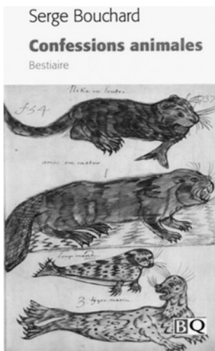
Serge Bouchard. Confessions animales. Bestiaire . Montréal, Bibliothèque québécoise, 2013, 206 p.

D'entrée jeu, signalons l'excellente initiative de cette réédition regroupant les textes intégraux des deux bestiaires pu-