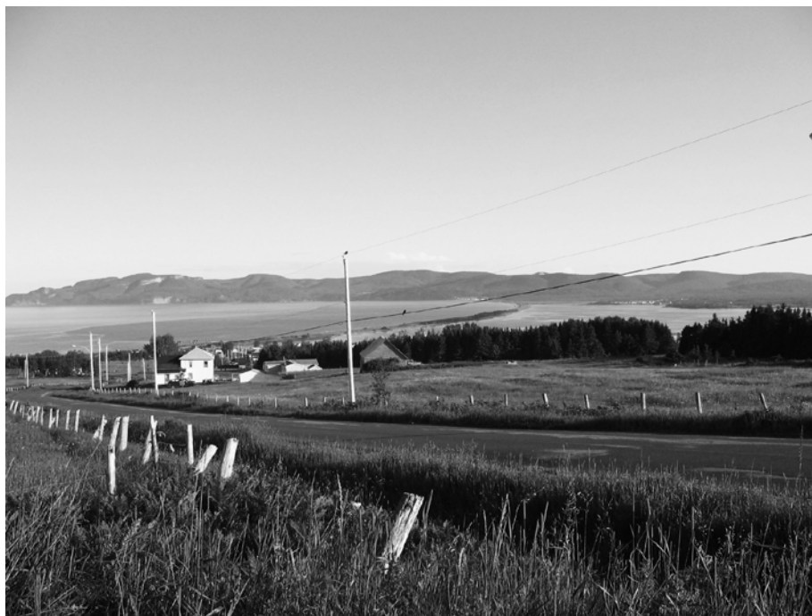
Vue de Saint-Georges-de-Malbaie et Barachois, en Gaspésie, juillet 2007.