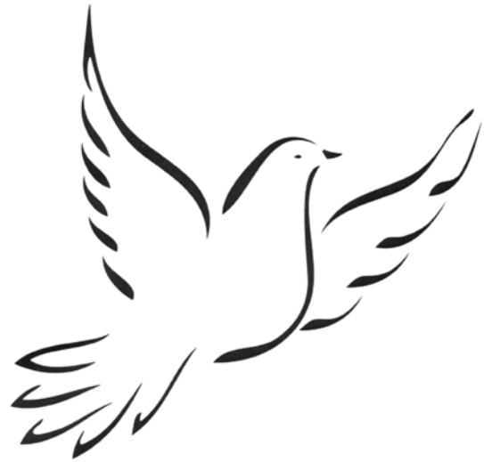
Dans l'Église catholique, la colombe symbolise souvent l'administration d'un sacrement.

La mise en valeur des vestiges des fortifications érigées à l'époque perpétue également la mémoire de ces événements : les forts Saint-Louis, tôt devenu Cham-