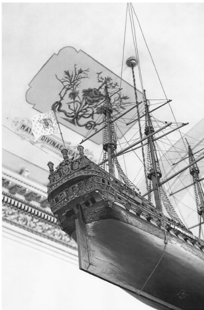
Cette maquette du navire Le Brézé a été offerte par le marquis de Tracy en ex-voto à l'église Notre-Dame-des-Victoires pour une traversée de l'Atlantique sans problème.

La venue des troupes de Carignan a été expliquée par le climat de terreur causé par le harcèlement de nations iroquoises. De fait, après la destruction de la Huronie, en 1648, des groupes iroquois ont dressé des embuscades et harcelé les Français, comme leurs alliés Hurons et Algonquins, dans toute la vallée du Saint-Laurent. Presque chaque année, entre