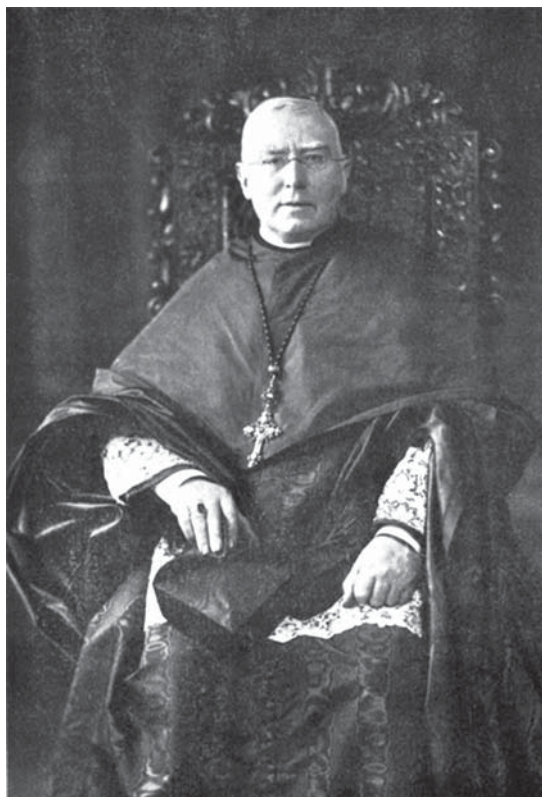
Francis Bourne (1861-1935), archevêque de Westminster, Angleterre.

Majoritaire durant tout le deuxième tiers du XIX e siècle, l'importante communauté anglophone de la ville représente toujours plus du tiers de ses habitants au début du siècle suivant. Cette minorité est largement surreprésentée au sein de la grande bourgeoisie capitaliste.