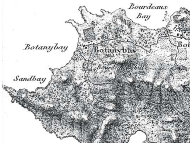
Botany Bay en Australie. Carte de l'établissement en 1834-1839. ( http://www.stjohnhistoricalsociety.org/Articles/BotanyBayEstate.htm ).

Dans un éditorial d'août 1839, de concert avec les pressions privées qu'exerçait depuis le début de la décennie la North American Colonial Association à Londres,