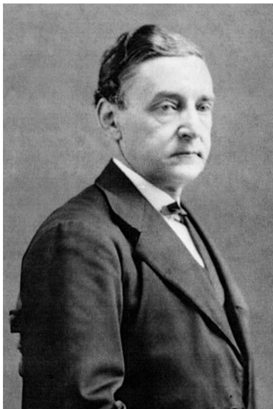
Antoine-Aimé Dorion, par William Notman, 1863. À la fin des années 1850, les « rouges » du Bas-Canada se positionnent en faveur de l'union fédérale. Dans un texte publié dans Le Pays et le Montreal Herald , ils affirment qu'un changement constitutionnel en faveur de la fédération est l'unique solution aux problèmes politiques de la province du Canada. Or, avec la formation de la grande coalition, en juin 1864, les libéraux bas-canadiens modifient leur prise de position. Le 8 août, lors d'une réunion spéciale, ils adoptent des résolutions dénonçant le projet de fédération des provinces et réclament le rappel de l'union législative. ( www.mccord-museum.qc.ca/scripts/imageload.php?accessNumber=I-6442&Lang=2&imageID=142451 )

Au cours de cette décennie, plusieurs tentatives individuelles et collectives