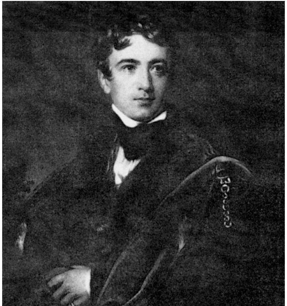
John George Lambton, 1 er comte de Durham (1729-1840).

D'autres hommes politiques haut-canadiens proposent des projets similaires, comme l'évêque John Strachan