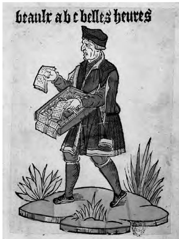
La Bibliothèque bleue fait son apparition au début du XVII e siècle, à Troyes, capitale de la Champagne. Cette région est alors l'une des plus alphabétisées de France. Cette forme de littérature répond ainsi à un besoin de la population en offrant des livres à prix modiques. Ces livres, imprimés sur du papier bleu de piètre qualité, sont distribués par des colporteurs comme on le voit ci-dessus. (Anonyme, Colporteur de livres , Anciens cris de Paris, gravure sur bois, Bibliothèque nationale de France, XVI e siècle, www.classes.bnf.fr/livre/grand/080.htm ).

Si ces pratiques superstitieuses apparaissent condamnables aux yeux des évêques et des communautés religieuses et que ces derniers se montrent sceptiques face à ces croyances, ils demeurent