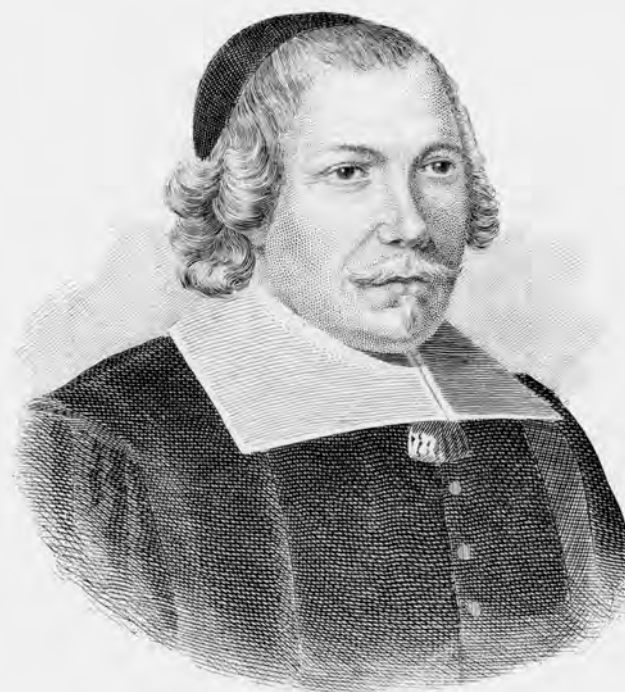
JÉRÔME LE ROYER DE LA DAUVERSIÈRE.

Instituteur des sœurs Hospitalières de La Flèche.