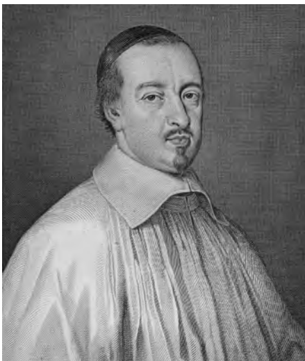
Jean-Jacques Olier (1608-1657), l'un des fondateurs de la Société de Notre-Dame. Il joua un rôle important au sein de l'association et en fut le directeur de 1650 à 1657. Tiré de Lettres de M. Olier, fondateur du Séminaire de Saint-Sulpice , tome 1, Paris, Librairie Victor Lecoffre, 1885.

Les fondateurs de la Société de Notre-Dame sont portés par une nostalgie des origines du christianisme. Désillusionnés par le monde qui les entoure, ces dévots