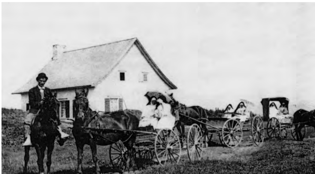
Visite des Augustines de l'Hôtel-Dieu à la ferme de Greslon, en 1909. (Archives du monastère des Augustines de l'Hôtel-Dieu de Québec).

Avec un apport de 30 000 livres de leur évêque bienfaiteur, l'Hôpital Général prend possession, en 1720, de la moitié de la seigneurie de La Durantaye, bientôt appelée seigneurie de Saint-Vallier, faisant 1 lieue et 27 arpents sur 3 lieues. Elles y exploiteront un domaine de 15 arpents sur la profondeur de la seigneurie, fournissant bétail, viande, poisson, produits maraîchers, céréales, farine et bois, transportés à Québec par barque. Elles y auront un moulin à eau qui, en 1747, viendra remplacer le moulin à vent. Encore ici, la gestion est efficace et les surplus sont vendus localement et à Québec. Le manoir sert même de maison de campagne à leur bienfaiteur.