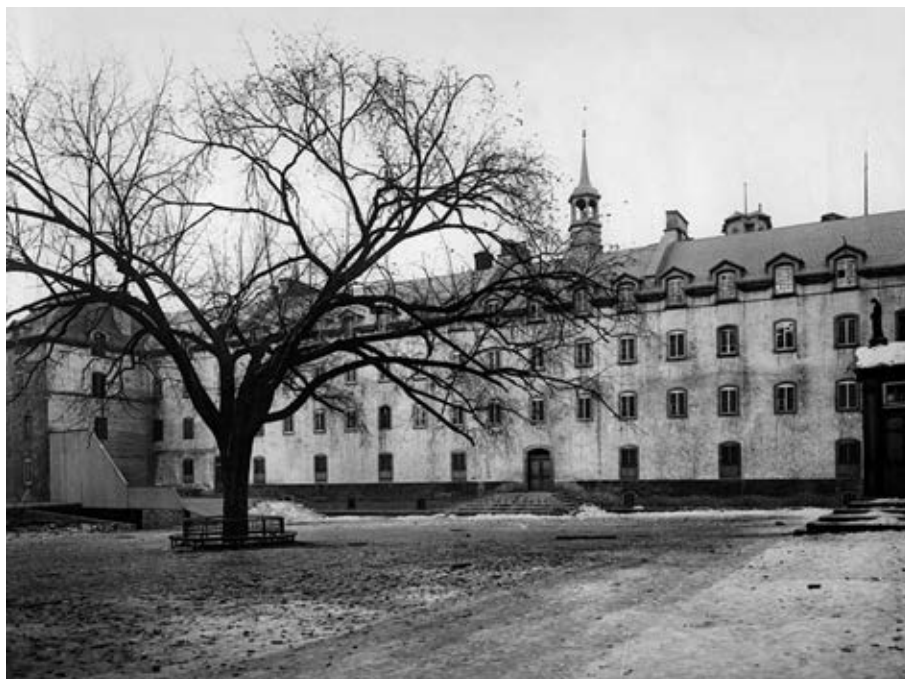
Cour intérieure du Séminaire de Québec, l'aile de la Procure et l'orme planté en 1860. Photo vers 1880.

Parmi les traits caractéristiques de cette pratique réformée du ministère, il y a non seulement le lien entre une piété vigoureuse et une pratique admirable de la charité, mais aussi cette appartenance à un réseau de soutien en quelque sorte. En d'autres mots, le ministère de François de Laval s'inscrit dans un