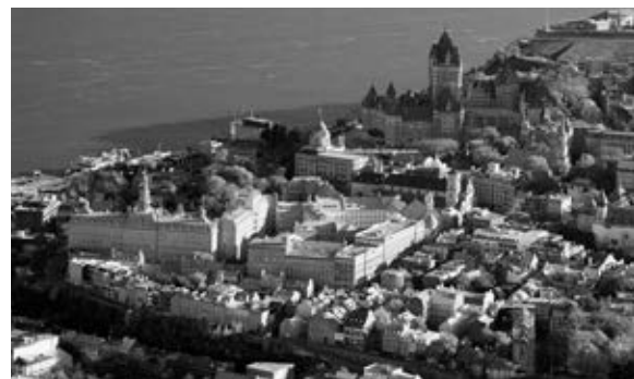
Vue aérienne de l'ensemble des bâtiments du Séminaire de Québec.

accepte de contribuer à l'éducation des jeunes gens, prenant le relais du collège des Jésuites. Le règlement de M gr Jean-Olivier Briand indique bien ce passage. Ce collège, taillé sur le modèle des collèges des Jésuites (Philippe Rocher, 2011), essaïmera et, bientôt, lorsque le Séminaire aura accepté de fonder l'Université Laval, il affiliera tous ces collèges en une faculté des arts qui construira de ce fait un réseau d'établissements d'éducation qui cultivera le goût de l'excellence. Au XX e siècle, ce réseau de collèges dispersés à travers tout le Québec servira dans plusieurs cas de base à l'édification du réseau public des cégeps.