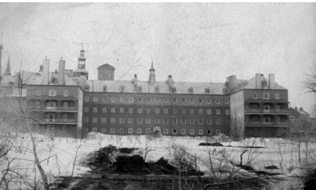
L'aile de la Procure du Séminaire de Québec vue des jardins. vers 1880.

Après avoir servi les arts et les sciences, étendant son rayonnement au-delà du Québec à travers l'Université Laval, le Séminaire de Québec est redevenu aujourd'hui une communauté de prêtres placée devant les défis qui étaient ceux de son fondateur en 1663 : comment réformer ou repenser l'activité apostolique dans un monde où les frontières sont repoussées et où de nouveaux horizons se dessinent, nous obligeant à repenser la place de l'homme dans l'univers. ■