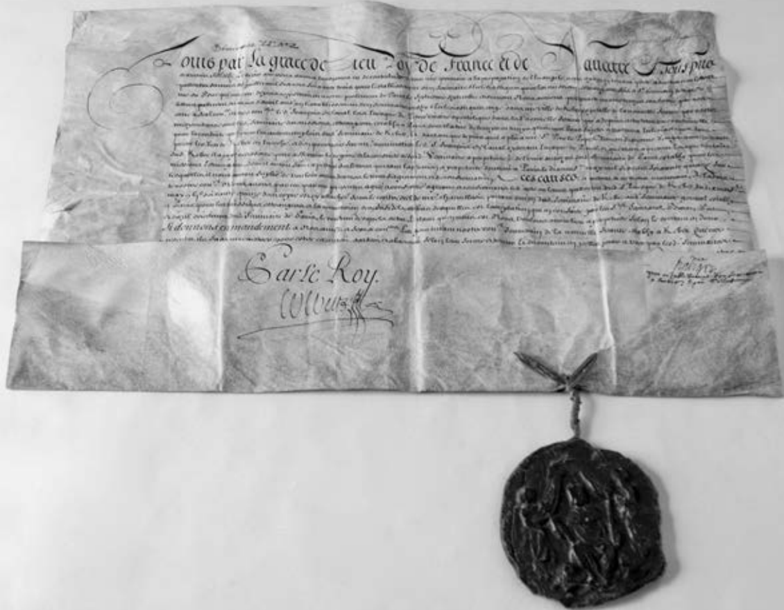
Lettres patentes du roi pour l'établissement du Séminaire de Québec signées par le roi Louis XIV, avril 1663.

100 ans auparavant. Ce concile avait conduit à une réforme de l'Église catholique, qui marquait particulièrement la France et qui s'exprimait à travers l'« École française de spiritualité ». François de Laval allait être lui-même mis en contact avec les meilleurs fruits de ce renouveau spirituel au moment de sa formation, d'abord au collège de La Flèche, dirigé par les Jésuites, et où séjournait non seulement l'élite, mais aussi Jean de Brébeuf avant de partir pour les missions de la Nouvelle-France. Le vivier jésuite, notamment le collège de Clermont à Paris, qui regroupait l'élite spirituelle, l'a nourri, de même que la société des Bons Amis, où il poursuivit son perfectionnement spirituel, et l'Ermitage de Jean de Bernières, un grand mystique, à Caen. Dans cette petite communauté de prêtres réformés, il s'adonne à l'oraison, combinant prière et œuvre de charité, dans la tradition d'une autre grande figure, Vincent de Paul, qui avait lui aussi