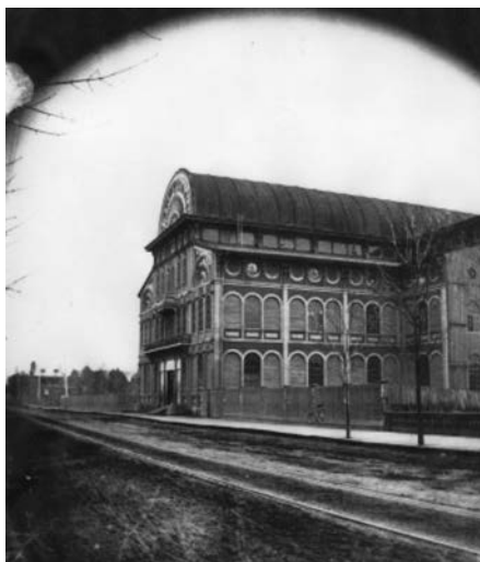
Palais de cristal de Montréal (1879-1896). Musée McCord, Montréal.