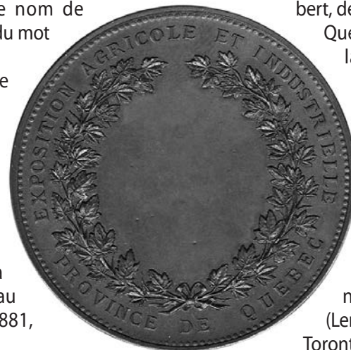
Revers de la médaille conçue par Adolphe-Louis Gerbier pour l'Exposition agricole et industrielle. (Coll. de l'auteur).

par le département du surintendant de l'Instruction publique (ancêtre de