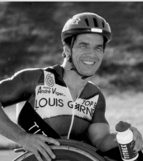
André Viger (1952-2006). En plus de ses succès à Boston, à Montréal et aux Jeux olympiques, André Viger a contribué à l'éclosion du sport paralympique au Canada.

Au tournant des années 1960-1970, la mode du jogging s'amorce aux États-Unis. Le Québec est également touché par cette nouvelle mode. À Boston, en 1971, les dirigeants du marathon établissent des standards afin de limiter les inscriptions. Ici, au Québec, le développement de l'athlétisme et la tenue des Jeux olympiques de 1976 ajoutent à la popularité croissante de la course à pied. Le nombre de Québécois présents à Boston progresse : en 1972, sur les 1 207 participants au marathon de Boston, 26 proviennent du Québec et en 1975, ils seront 28.