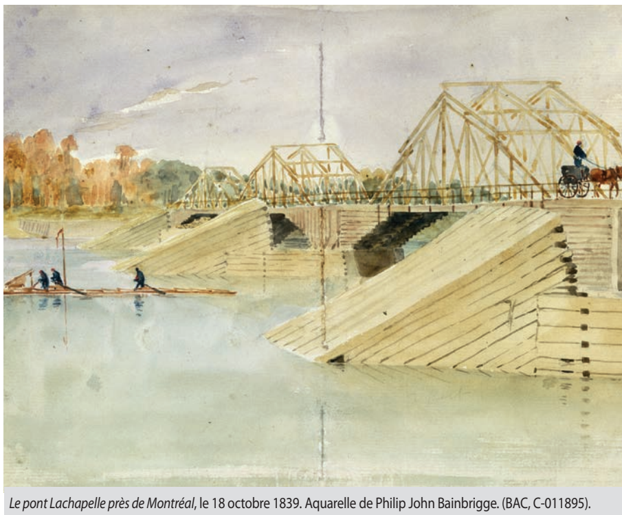
Le pont Lachapelle près de Montréal, le 18 octobre 1839. Aquarelle de Philip John Bainbrigge.

Le second volet de la politique provinciale en matière de voirie est l'aide financière aux municipalités qui désirent améliorer la voirie locale. Après l'adoption des lois des bons chemins en 1911 et 1912, des sommes importantes sont investies pour différents travaux. On procède d'abord à l'aménagement d'un réseau de grandes routes provinciales. Dans les années 1920, ce sont les chemins secondaires qui retiennent l'attention de la Voirie. La construction des nouveaux ponts et la réfection des plus anciens dépendent quant à elles du ministère des Travaux publics, qui fait les plans et devis et contribue financièrement aux travaux de construction. De 1908 à 1920, 574 ponts sont mis en chantier et 24 ponts à péage sont rachetés. À compter de 1922, le ministère conseille aussi les municipalités sur leur entretien et les réparations à leur apporter.