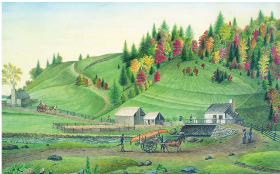
Vue du pont de la rivière du Sault-à-la-Puce, près de Québec, 1790. Aquarelle de Thomas Davies.

appuyés sur des caissons de bois et de pierre pour en allonger la portée. Ils inspirent aussi les écrivains. Ainsi, Philippe Aubert de Gaspé écrit, en 1863, dans Les Anciens Canadiens : « J'ai dit [...] que j'étais ami du progrès : je me rétracte. La civilisation a tué la poésie : il n'y en a plus que pour le voyageur. Belle prouesse, en effet, exploit bien glorieux que de passer sur un pont solide comme un roc, et assis confortablement dans une bonne voiture! » Et il ajoute, en parlant des constructeurs : « On a proclamé bien haut que ces messieurs avaient été les bienfaiteurs de leur pays! Bienfaiteurs, oui; mais, poètes, non. »