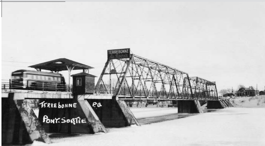
Le pont métallique de Terrebonne, vers 1945. Carte postale photo. (BAHQ-M, Centre de conservation, Collection Marcel Paquette).

nauté considérée comme un conservatoire des traditions françaises. Le pont de Sainte-Anne à Chicoutimi, qui relie les deux rives du Saguenay depuis 1933, représente également un exploit pour ses concepteurs, en particulier par sa travée centrale pivotante en porte-à-faux, la plus longue structure du genre en Amérique. Ces deux contrats, comme beaucoup d'autres, sont exécutés par la Dominion Bridge de Montréal, reconnue pour son expertise.