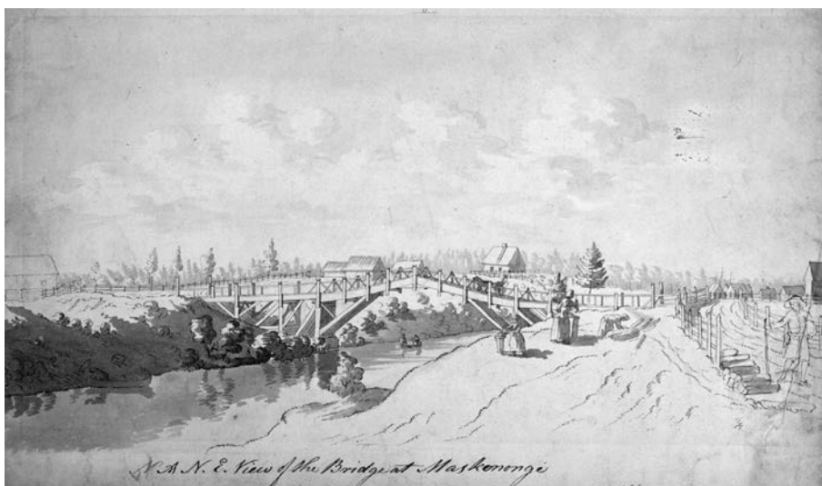
Vue du pont de Maskinongé depuis le nord-ouest, vers 1783. Dessin de James Peachey. (BAC, C-04556).

On pourrait dire que les premiers ponts de la Nouvelle-France ont été des ponts de glace. Les premiers habitants de la seigneurie de Notre-Dame-des-Anges (Charlesbourg) et de la région située à l'est de la rivière Saint-Charles, incluant l'île d'Orléans, de même que ceux de la rive sud empruntent les chemins balisés sur le Saint-Laurent pour traverser à Québec en hiver. En été, ceux de la rive nord doivent franchir la rivière Saint-Charles à gué. En vertu d'une ordonnance datée du 27 juillet 1667, les Jésuites se voient confirmer le pri-