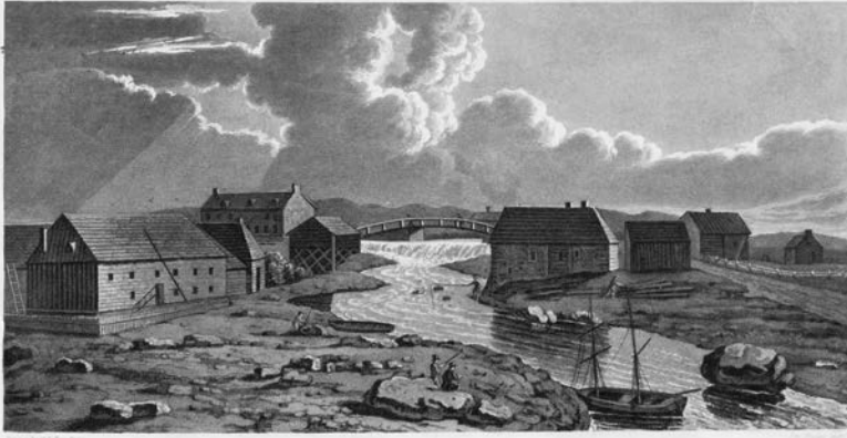
Narrowed Distillery & Mill on the River Trois-Saumons

Le pont de la rivière Trois-Saumons, à Saint-Jean-Port-Joli, 1832. Gravure rehaussée à l'aquarelle d'après un dessin de Joseph Bouchette. (Collection privée).