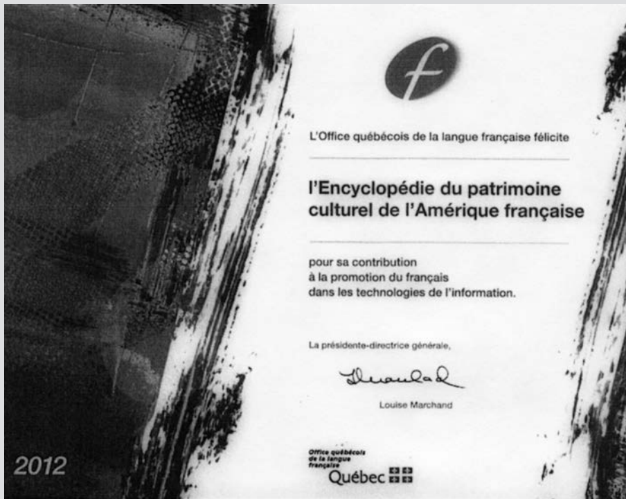
Prix Mérites du français 2012 remis à l' Encyclopédie du patrimoine culturel de l'Amérique française .

L' Encyclopédie repose sur la collaboration d'une vingtaine de partenaires répartis dans six provinces canadiennes, ainsi qu'en France et aux États-Unis. Elle est toujours en développement et s'enrichit constamment de nouveaux articles et de nouveaux documents multimédias.