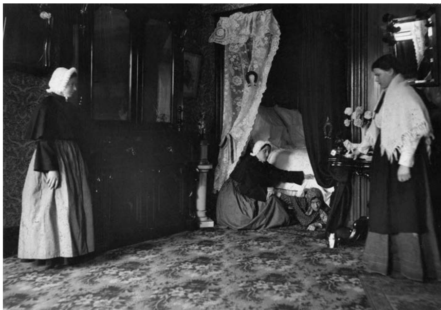
« Mise en scène prise en 1910 par Montminy & Cie. On y aperçoit deux dames pieuses qui viennent sortir une jeune fille d'une maison de débauche de Québec pour la ramener dans un milieu sécuritaire, à savoir l'asile Sainte-Madeleine. Les Sœurs du Bon-Pasteur de Québec et les Sœurs du Bon-Pasteur de Montréal – qui, malgré leur nom, sont deux communautés différentes – s'investissent activement dans l'aide aux femmes victimes de la prostitution dès le milieu du XIX e siècle. » (Collection Les Sœurs du Bon-Pasteur de Québec).

La prostitution dérange en raison de sa visibilité. Puisque la sollicitation se déroule dans un espace public, les élites urbaines ne sauraient tolérer pareil désordre. Celles-ci s'organisent en associations et exercent des pressions sur l'État qui soumet les prostituées à des lois de plus en plus strictes. Alors que, dans les années 1860, les filles de joie et ceux qui fréquentent les maisons de désordre sont accusés de vagabondage et sont seulement punis lorsqu'ils troublent l'ordre public, le Code criminel de 1892 fait de la prostitution un crime à part entière. Il rend désormais illégal le simple fait de tenir « ou habite[r] une maison déréglée, de prostitution ou