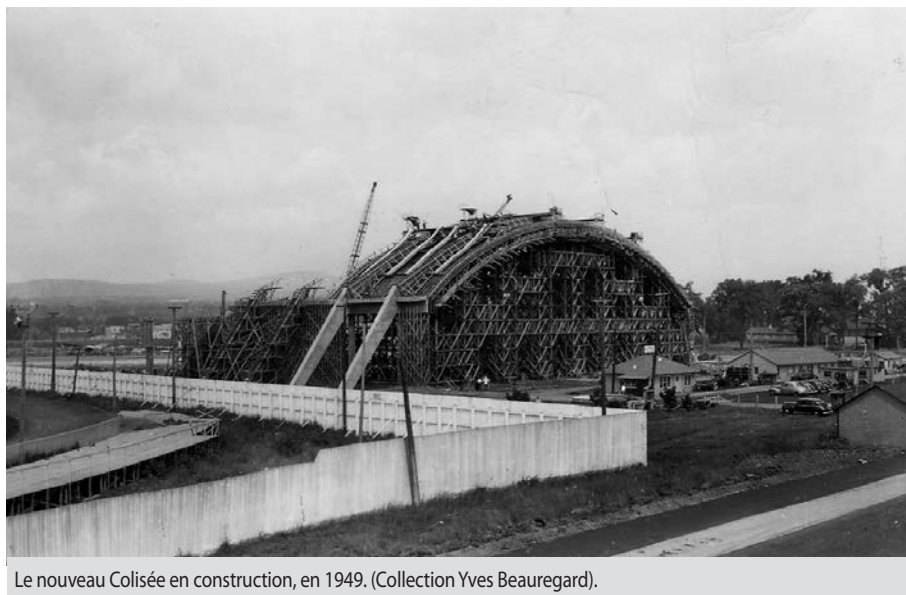
Le nouveau Colisée en construction, en 1949.

crit au registre des propriétés historiques de la Colombie-Britannique. Le Halifax Forum en briques rouges, édifié en 1926, et l'aréna W.C. O'Neill, bâtiment d'architecture moderne, construit en 1962, sont protégés en Nouvelle-Écosse et au Nouveau-Brunswick. Enfin, le Forum de Montréal (1926) et le Maple Leaf Garden de Toronto (1931) sont devenus des lieux historiques nationaux en 1997 et 2007,