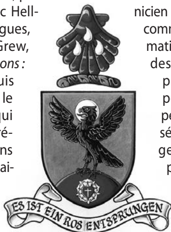
Armoiries de l'église luthérienne Saint-Jean, Montréal.