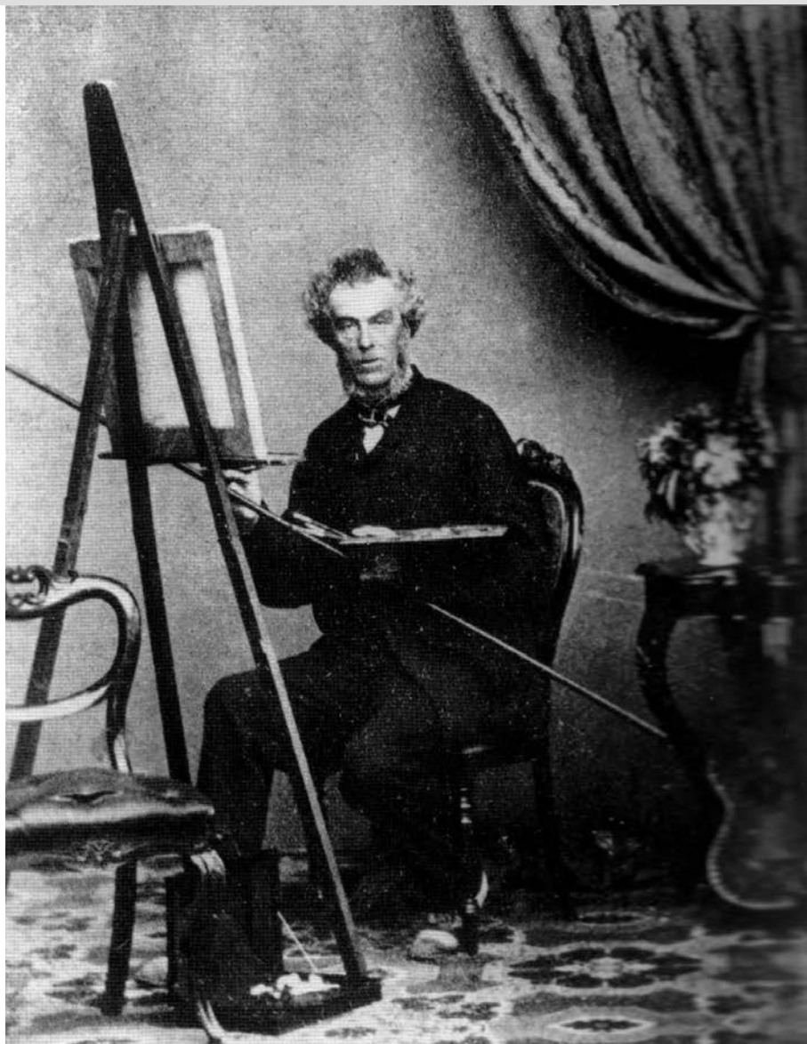
Cornelius Krieghoff est né le 18 juin 1815, à Amsterdam. Lui et sa famille déménagent en Allemagne, en 1819, d'abord à Dusseldorf puis à Mainbourg. À seize ans, il est envoyé à Schweinfurt en Bavière pour étudier la peinture. Plus tard, il aura comme professeur Wilhelm von Schadow. (Québec, vers 1870.).

Au XX e siècle, les germanophones s'installent surtout en Ontario puis dans les Prairies, mais Montréal continue d'en accueillir. Lorsque s'estompent les discriminations antiallemandes liées à la Première Guerre mondiale, l'immigration germanophone, en particulier en provenance de l'est de l'Europe, reprend. En 1931, les « Souabes du Danube », originaires d'enclaves germanophones de Roumanie ou de Yougoslavie (et dont les ancêtres venaient d'Allemagne, mais pas forcément de Souabe), représentent un tiers des Allemands du Québec. Souvent catholiques, ils forment aujourd'hui encore une sous-communauté originale, marquée par une mémoire spécifique et par des rapports parfois distants avec les Allemands originaires d'Allemagne. Par l'ancienneté de leur ancrage montréalais, et contrairement aux immigrants des années 1950 et 1960, ils conservent le souvenir de l'ancien quartier allemand – dont les seules traces sont actuellement les églises Saint-Boniface (catholique) et Saint-Jean (protestante), puisque l'ascension sociale a entraîné le départ des paroissiens vers la périphérie. Certains évoquent encore le boulevard Saint-Laurent des années 1930, en particulier la coexistence avec les Juifs yiddishophones pendant la grande dépression.