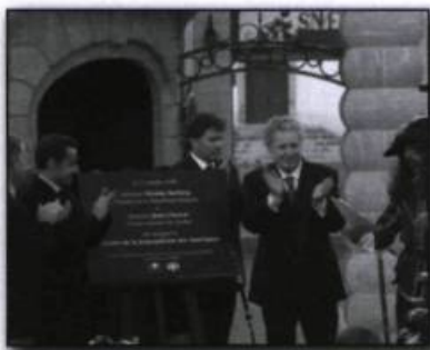
Inauguration du Centre de la francophonie des Amériques, le 17 octobre 2008, par le président de la République, Nicolas Sarkozy, et le premier ministre du Québec, Jean Charest.

la capitale, la France a offert au Québec l'aménagement architectural des espaces publics du nouveau Centre de la francophonie des Amériques dont la mission est de favoriser et de promouvoir la culture francophone sur le continent américain.