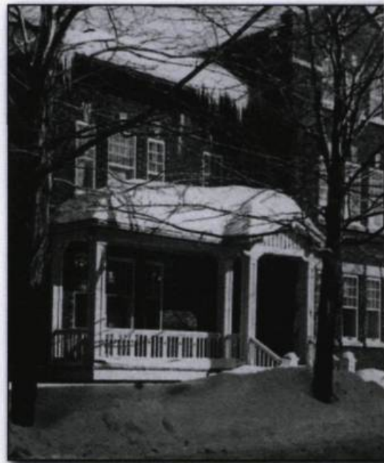
Résidence du consulat de France, avenue de la Tour à Québec.

Le 5 septembre 1928, Édouard-Maurice Carteron succède à Vitrolles. D'abord nommé « consul de première classe chargé du consulat général de Montréal », il est promu quelques mois tard consul général. Il demeure cinq ans en poste, et est remplacé en 1933 par René-Antoine Turck. Celui-ci participe notamment aux célébrations entourant le