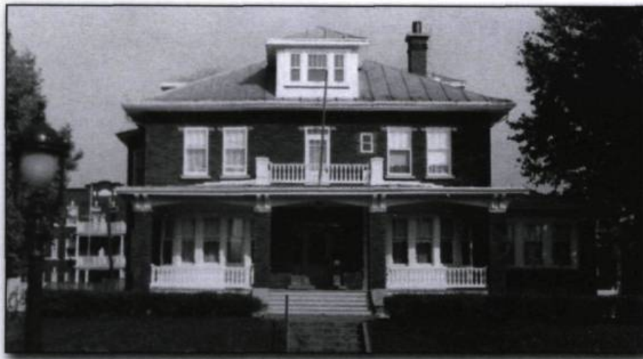
Résidence du consulat général de France, rue des Braves à Québec.

pressions budgétaires imposées de part et d'autre, la Commission permanente de coopération continue de soutenir les échanges entre les deux communautés, preuve de l'incontestable vitalité des relations franco-québécoises. En dépit de plusieurs tentatives de l'ambassade de France à Ottawa de rapatrier en son sein les pouvoirs du consulat 23 , le statut particulier de la représentation française a été préservé.