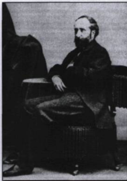
Charles-Henri-Philippe, baron Gauldrée-Boilleau, né en 1823. Il est nommé consul de première classe à Québec, le 9 juin 1859. Il restera en poste jusqu'au 12 août 1863. (Pierre Savard, Le consulat général de France à Québec et à Montréal de 1859 à 1914 . Québec, Les Presses de l'Université Laval, 1970, 133 p.).

Pendant son mandat, Gauldrée-Boilleau tente également de rehausser le statut diplomatique du consulat, puisqu'en vertu des coutumes britanniques, les consuls étrangers ne jouissaient