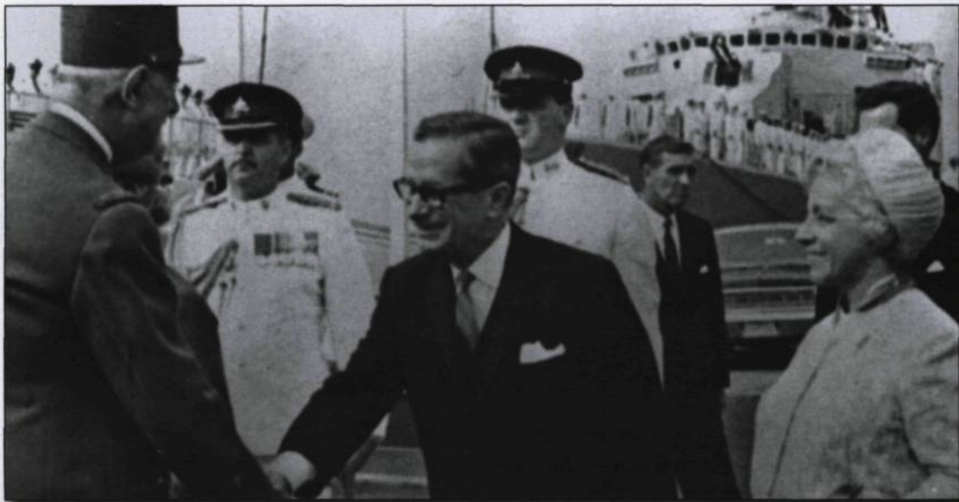
Voyage historique de Charles de Gaulle, président de la République française, au Québec, en 1967. Il est accueilli à Québec par le premier ministre Daniel Johnson et son épouse.