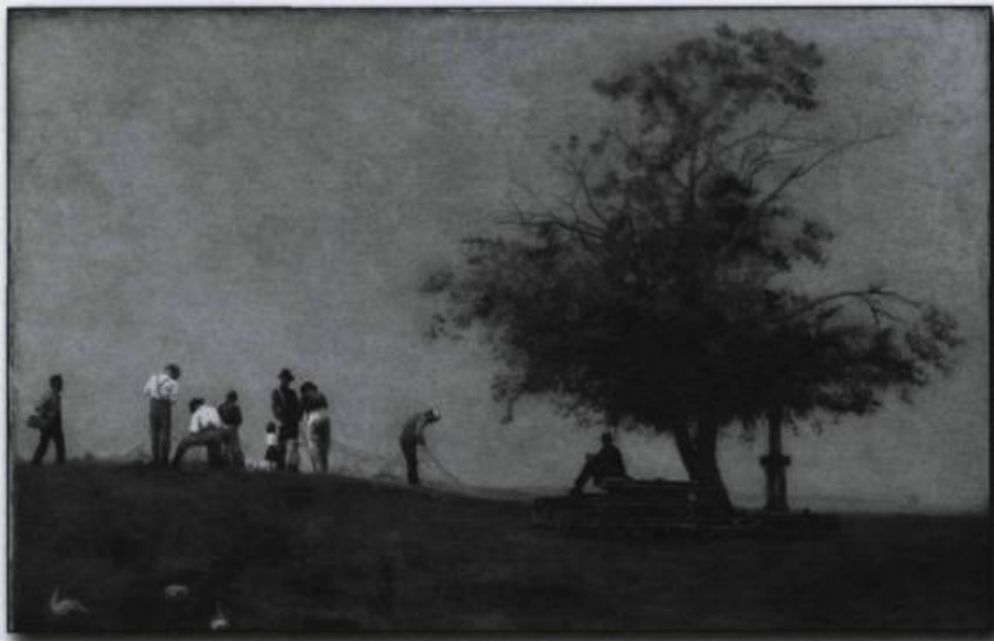
Thomas Eakins. Le raccommodage du filet , 1881. Huile sur toile. 81,6 x 114,6 cm. (Philadelphia Museum of Art).