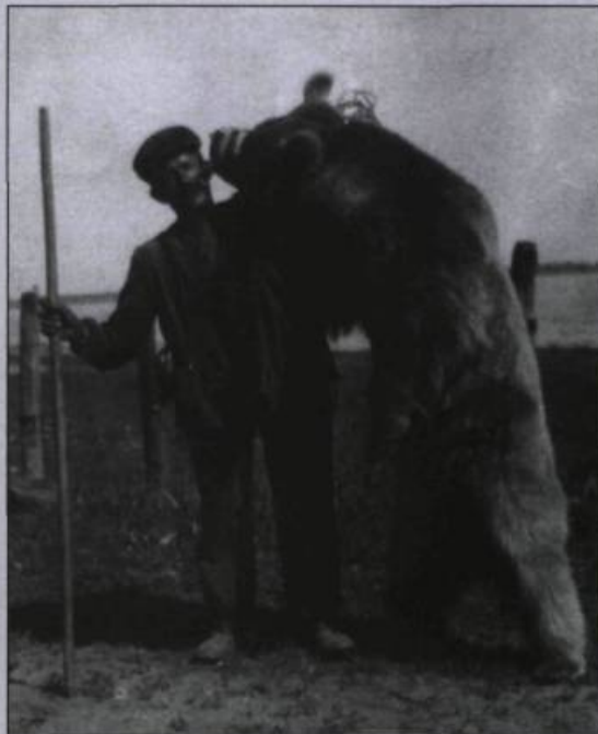
■ Montreur d'ours dans le secteur Pointe-du-Lac à Trois-Rivières, 1914.