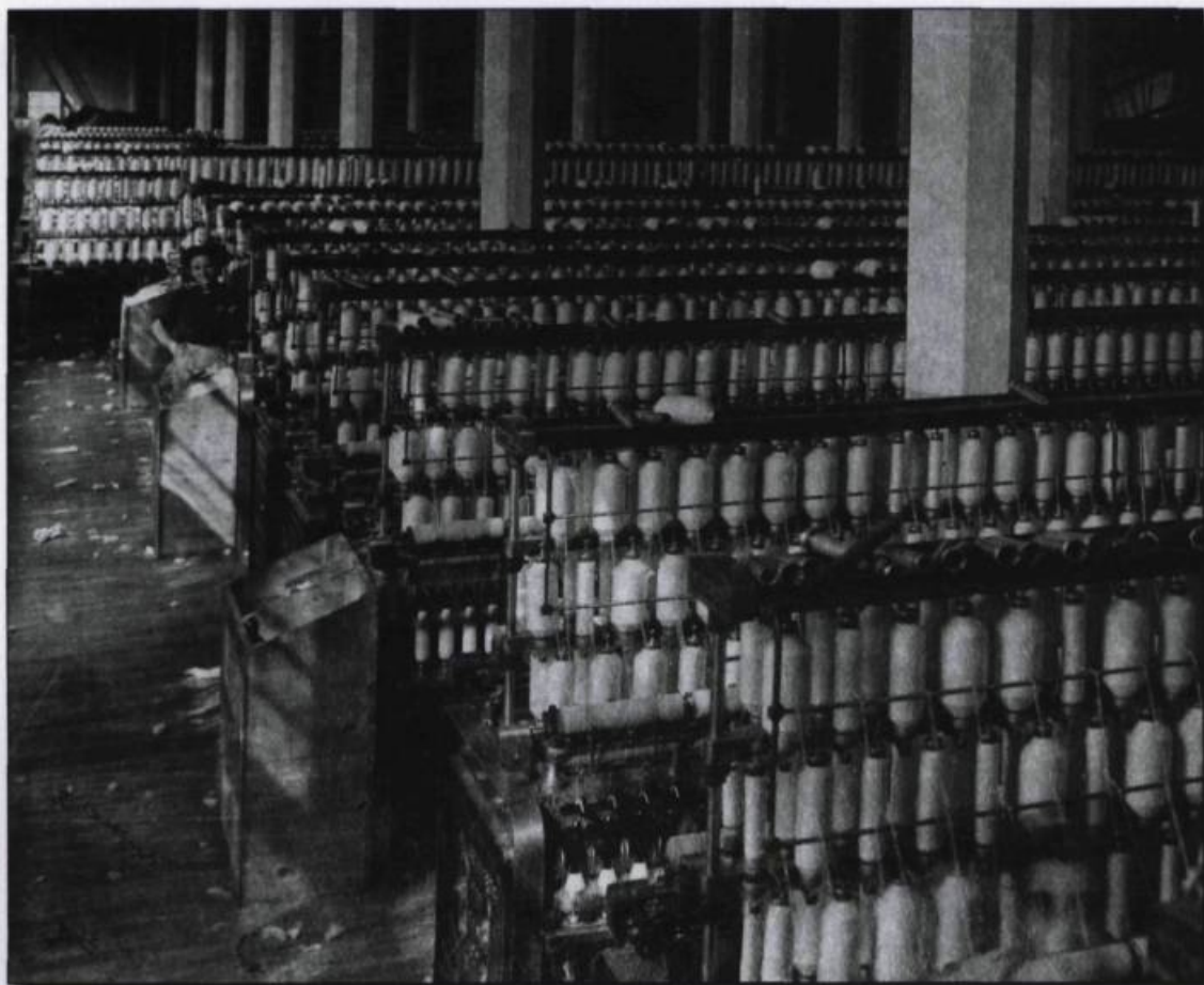
Production à la Wabasso, 1923.

sept jours sur sept. En 1920, les ouvriers de la Wabasso ont été menacés de congédiement lorsqu'ils se sont absentés pour assister à la messe de l'Immaculée Conception, le 8 décembre 1920. Whitehead, des notables et l'évêque en arrivèrent à des compromis sur le travail du dimanche et sur le calendrier des fêtes chômées.