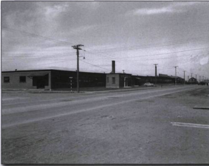
■ Mason Spinning Mills, 1945. (Archives Le Nouvelliste , N4206).

■ succès de cette usine soulignait, dès 1917, la nécessité d'attirer à Trois-Rivières une manufacture de soie. Elle produisait des vêtements de travail, des chemises de toilette et des pyjamas, en partie pour l'exportation. Elle a également produit des chemises pour l'armée canadienne lors de la Deuxième Guerre mondiale. L'usine fut vendue à la Style Guild, qui fabriquait aussi des chemises.