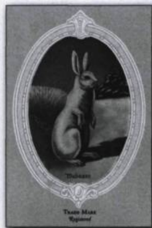
Logo de la Wabasso.

L'autre usine, la Falomar, embauche plus de 150 ouvrières et confectionne des robes à partir de tissus en soie produits à l'Associated Textile de Louiseville. Le journal disait, à l'automne 1930, que Cap-de-la-Madeleine était « appelé à un magnifique avenir industriel » avec la Canadian T.S.R. et la Falomar. Il répétait, au printemps 1931, qu'elles étaient « deux industries florissantes ». Ce fut de courte durée puisque la Falomar ferma ses portes en 1931 pour déménager à Montréal. La compagnie se disait incapable de payer le salaire minimum aux femmes, fixé pour les manufactures à 6 $ par semaine par la Commission du salaire des femmes. Falomar ne payait que 4 $ en alléguant des problèmes de transport. Les directeurs prétendaient aussi que les jeunes filles employées ne semblaient pas respecter l'autorité ni manifester de l'intérêt pour leur travail. En 1932, la Sterling Shirts and Overalls, fondée à Trois-Rivières en 1912 par Fred Aboud, s'installe dans l'ancien édifice de la Falomar. Le