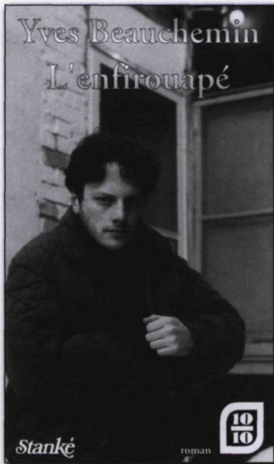
Page couverture de L'enfirouapé d'Yves Beauchemin, 1974, 263 p. (Collection Cap-aux-Diamants).

Une recherche dans la documentation du TLFO permet de trouver des mots dont la forme et le sens pourraient bien avoir été à la source de celui qui nous occupe. Il semble que nous ayons affaire à un croisement entre le verbe argotique enfifrer (qui signifiait « enculer », mais aussi « tromper »), attesté en argot parisien au XIX e siècle (voir Delesalle 1896 et Chautard 1931, p. 374), et le verbe québécois, aujourd'hui désuet, rouâper signifiant « râper » mais aussi « gronder, réprimander », dérivé de rouâpe (sorte de tisonnier), mots bien attestés à l'époque où apparaît enfifrewâper (Fonds TLFO). Ces deux éléments per-