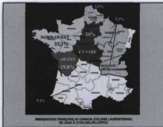
Immigration française au Canada (colonie Laurentienne) de 1640 à 1700 (selon Lortie).

La conséquence est que le français du Québec a été marqué d'abord par l'influence de la Normandie et du Perche, puis par celle des provinces de l'Ouest; celle du Centre s'est exercée pendant tout le XVII e siècle, notamment à travers la langue des représentants de l'administration métropolitaine en poste à Québec. Le français