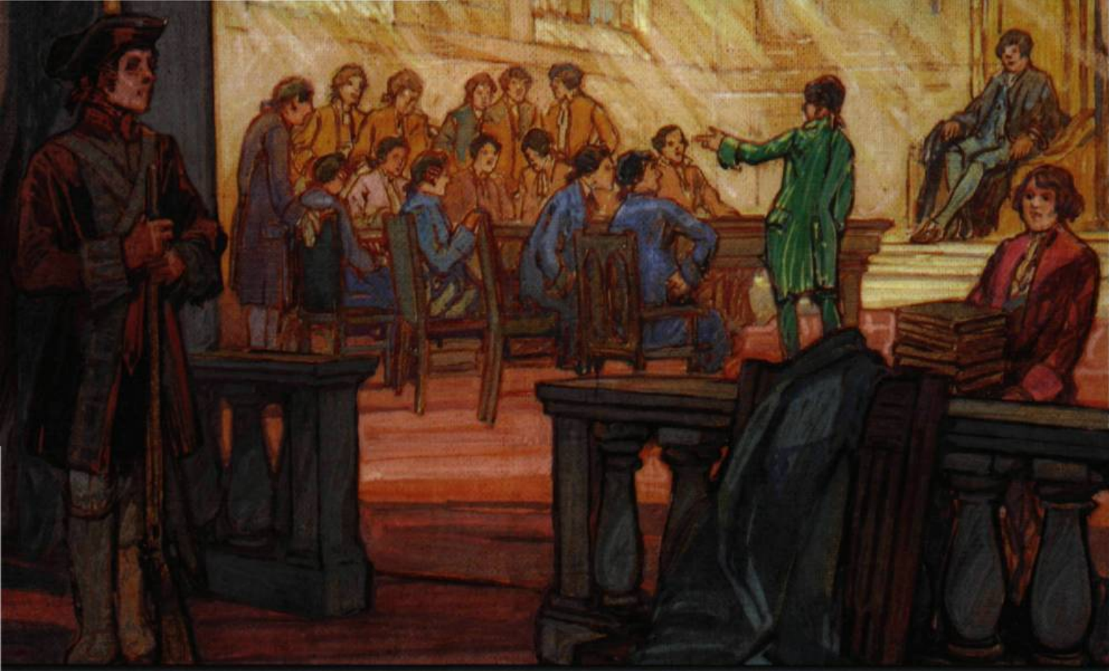
Charles W. Simpson a imaginé, en 1927, l'une des premières séances du Conseil législatif de Québec institué par l'Acte de Québec.

« LE QUÉBEC N'EST PAS UNE PROVINCE COMME LES AUTRES. »