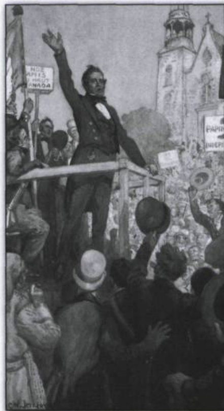
Papineau s'adressant à la foule à l'Assemblée des six comtés. Aquarelle de Charles William Jefferys, vers 1925.

mise en écrin des bijoux et grâce à une « mise en espace » qui utilise efficacement la superficie disponible, l'exposition 1837-1838. Rébellions, Patriotes vs Loyaux guide le visiteur à travers une vingtaine de tableaux informatifs, une dizaine de portraits dont un Papineau peint par Antoine Plamondon en 1830 ou un Wolfred Nelson peint par Théophile Hamel en 1840, une vingtaine de gravures et dessins d'époque et près de 150 artefacts ayant appartenu à des acteurs ou des témoins de ces événements.